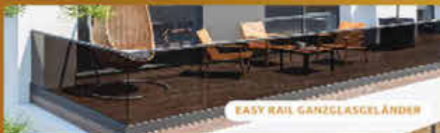
EASY RAIL GANZGLASGELÄNDER