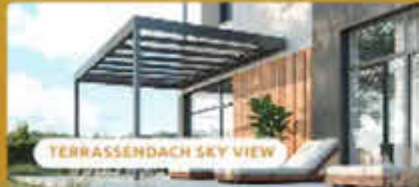
TERRASSENDACH SKY VIEW