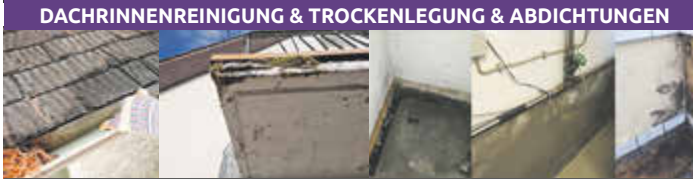
DACHRINNENREINIGUNG & TROCKENLEGUNG & ABDICHTUNGEN

REINIGUNG VON: AUßENANLAGEN - FASSADEN - NATURSTEIN BETON - PFLASTERSTEIN - SOWIE DACHFLÄCHEN UND DACHRINNEN