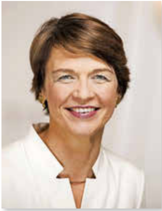
Elke Büdenbender, die Ehefrau des Bundespräsidenten, ist Richterin und setzt sich für die klischeefreie Berufswahl ein.

Ihren Job sollten Jugendliche frei von Klischees wählen dürfen