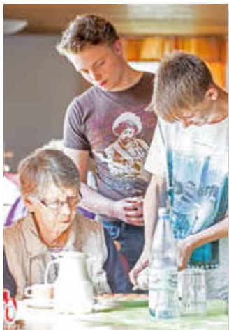
Altenpflege ist längst nicht den Frauen allein vorbehalten.

Die Berufs- und Studienwahl erfolgt bei jungen Menschen im besten Fall also nach individuellen Fähigkeiten, Fertigkeiten, Interessen und Erfahrungen. Doch vorhandene Geschlechterklischees beeinflussen häufig die Entscheidung und schränken das Spektrum der Möglichkeiten ein. Sie tragen dazu bei, dass Potenziale verschenkt werden und Menschen mit ihrer Berufswahl nicht zufrieden sind. Von weniger Klischees