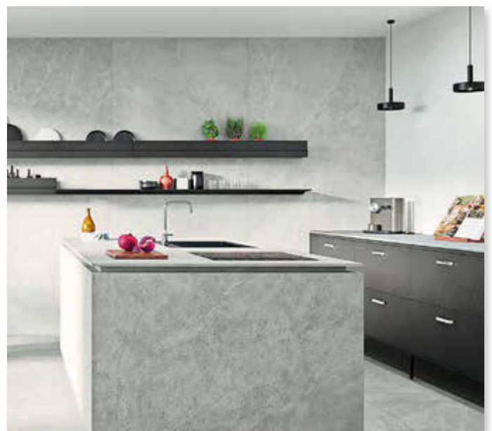
Bereits seit einigen Jahren gefragt und immer noch aktuell: urbaner Beton-Look mit Industrial-Elementen.