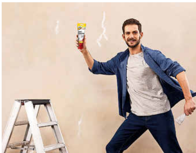
Gebrauchsfertige Spachtelmassen in der Tube sind die clevere Lösung für unterschiedliche Heimwerkerprojekte.

Der Reparatur-Spachtel wiederum eignet sich sehr gut zum Reparieren von beschädigtem Holz im Innen- und Außenbereich, zum Beispiel an Fenstern, Türen, Möbeln sowie Fachwerk. Mit dieser Spachtelmasse können Heimwerker größere Risse, Löcher, beschädigte Kanten, Astlöcher und sonstige Fehlstellen im Holz zuverlässig ausbessern. Nach dem Trocknen wird die Spachtelmasse extrem hart, bleibt aber – genau wie Holz – sehr flexibel.