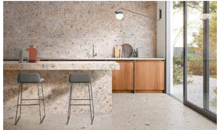
Hochwertige Innenarchitektur: Naturstein-Look für Wand- und Bodenflächen im XL-Format.

Schwarz, der Megatrend für Mutige im Bad- und Wohnbereich, erobert auch die Küche. Fliesen im Brick-Design schaffen dekorative Kontraste zu dunklen Möbelfronten und Armaturen in Schwarz, Messing oder Kupfer. Eine gute Wahl für alle, die dem Raum eine luxuriöse Note verleihen möchten.