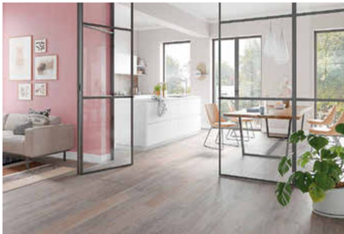
Kochen, essen, leben, eng verbunden: Feinsteinzeug im Holzdekor sorgt für Wohnstil und Nutzungskomfort im Herzen des Familienlebens.

Bereits seit mehreren Jahren angesagt und nach wie vor aktuell ist der industrielle Charme von Beton pur. Fliesen und Möbeloberflächen in Beton-Optik harmonieren mit Industrial Design im Stahl-Look oder in Schwarz.