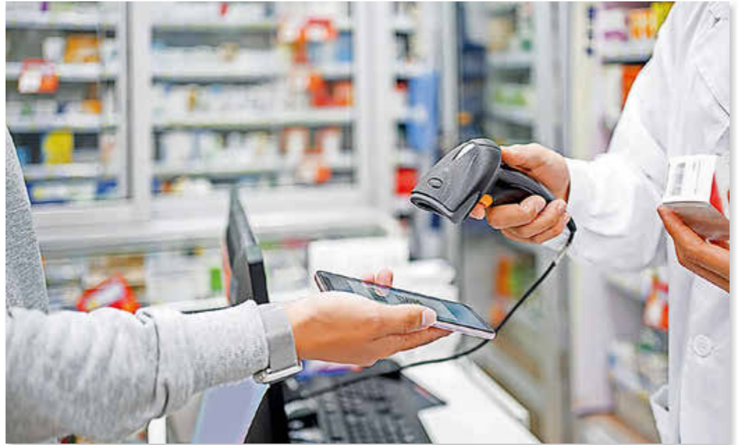
So einfach soll es gehen: Das E-Rezept übers Smartphone einfach in der Apotheke einlesen lassen und die Medikamente erhalten.

„Das E-Rezept wird in der ärztlichen Praxis digital erstellt und dort in der Cloud abgelegt“, so Berlin.