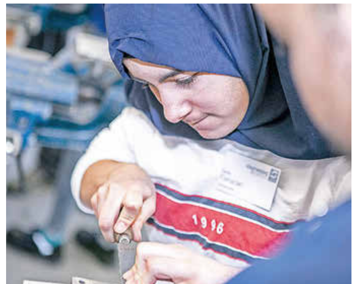
Auch Mädchen können in handwerklichen Berufen richtig gut sein.

unterschiedlichen Perspektiven zum Erfolg beitragen. Sie erhalten zudem die Möglichkeit, dem Fachkräftemangel etwas entgegenzusetzen, der besonders in Berufen ausgeprägt ist, die zahlenmäßig von einem Geschlecht dominiert werden.