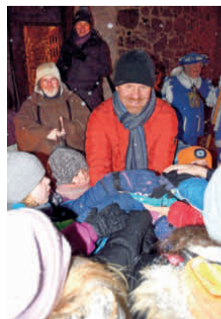
Roter Buzzer-Anzünden der Kerze 2023