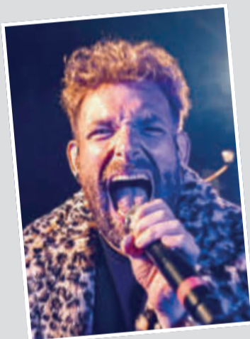
Reiner Irrsinn