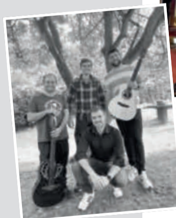
Take this Foto: Take this