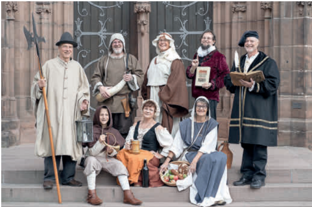
Stadtführer von Homberg