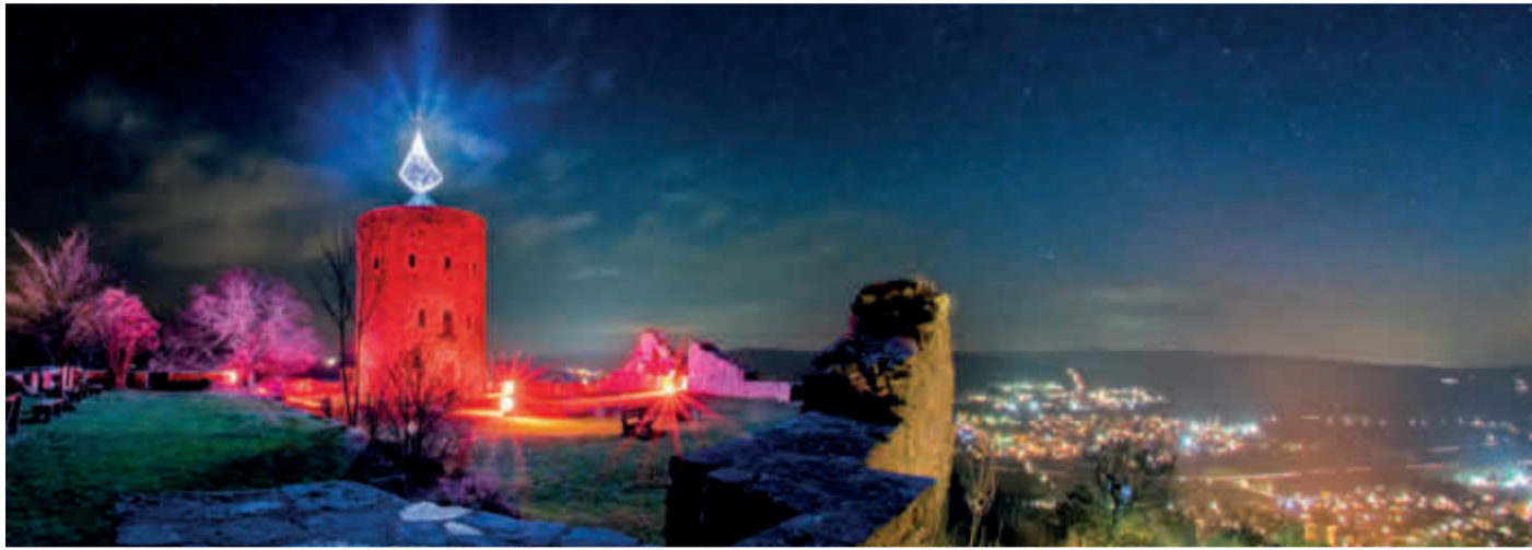
Anzünden der Burgkerze

Der traditionelle Fackel- und Laternenumzug vom Marktplatz aus findet wieder um 17 Uhr statt. Er wird von der THW-Jugend Homberg begleitet und abgesichert.