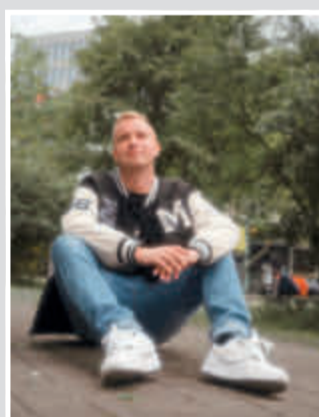
Patrick Heidenreich