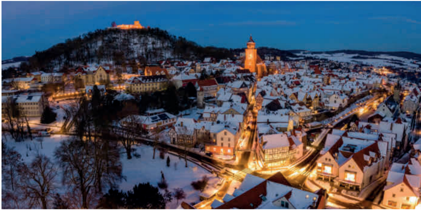
Winterabend in Homberg (Efze)