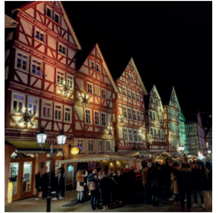
Glühwein gehört einfach dazu.