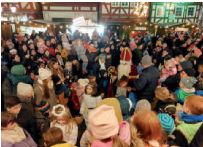
Der Nikolaus kommt