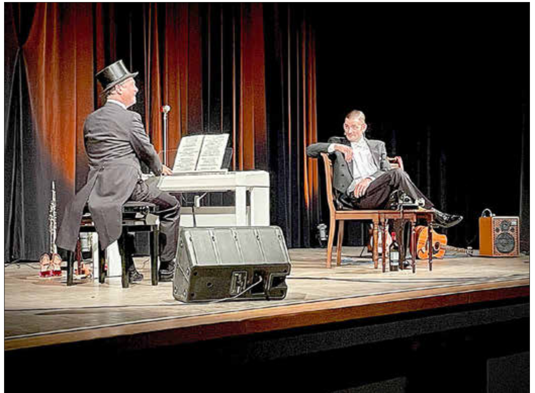
Das Kasseler Herrenkonfekt präsentierte „Herren sind ... besser als ihr Ruf“.

„Wir begeben uns auf dünnes Eis“, kündigten die beiden wissend und augenzwinkernd an. Es folgte ein Streifzug durch das Mysterium des Mannseins – von der Mutterwarnung „Männer sind Schweine“ (inklusive Bananenrassel) bis hin zum Lied über den Rebellen, der im Zug die Notbremse zieht.