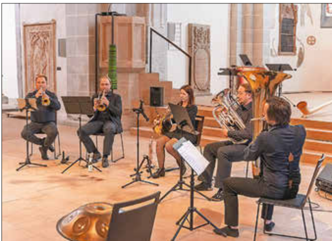
Das Blechblasensemble von BrassBand Nord und der Musikschule Söhre-Kaufunger Wald.