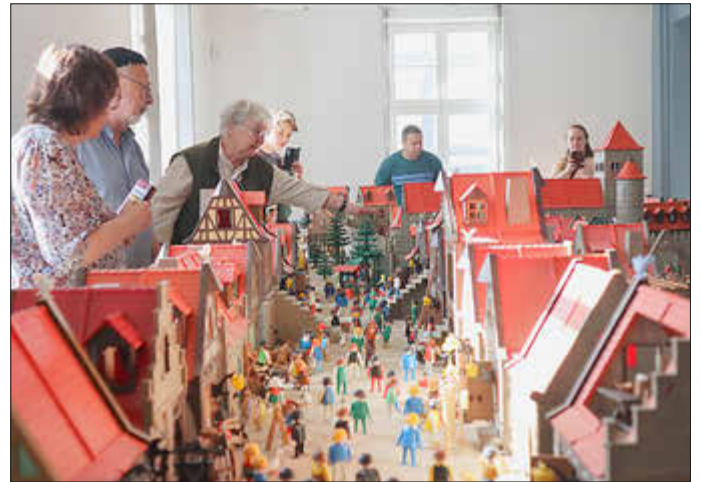
Es gibt viel zu entdecken im Miniatur-Kaufungen.