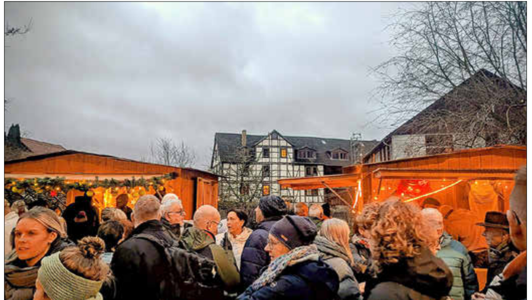
Ein gemütliches Zusammenkommen am Abend mit Glühwein und Punsch.

Somit wurde der alte Kirchplatz erneut zu einem beliebten Treffpunkt für große und kleine Besucherinnen und Besucher. Auch das Bühnenprogramm bot wieder zahlreiche Höhepunkte: Um 15:30 Uhr lud ein gemeinsames Singen von Advents- und Weihnachtsliedern zum Einstimmen auf die Adventszeit ein.