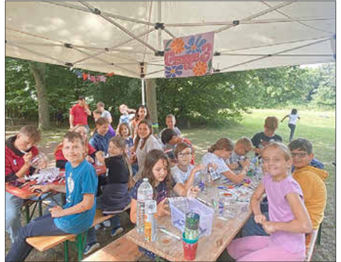
An unterschiedlichen Mitmach-Stationen konnten die teilnehmenden Kinder kreativ werden.