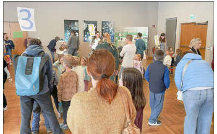
Lebendige Begegnungen gab es rund um den Medientag der Kitas und Grundschulen im Bürgerhaus Kaufungerwald.

Drei verschiedene Workshops boten den teilnehmenden Kindern die Möglichkeit, in wechselnden Kleingruppen spannende und lehrreiche Erfahrungen im Umgang mit iPads und anderen Medien zu sammeln. Dabei ging es nicht nur um den Konsum digitaler