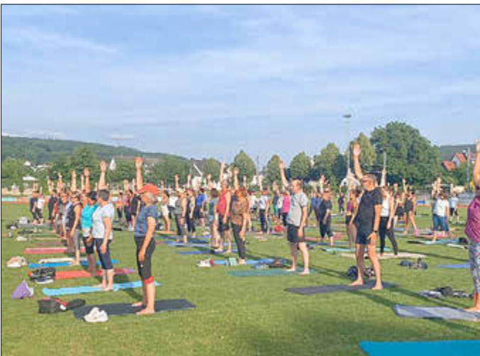
Gemeinsames Eintauchen in die Welt der Asanas.

Brücken zwischen Menschen schlägt.“ Auch unter den Teilnehmenden war die Resonanz durchweg positiv. Eine Teilnehmerin fasste den Abend so zusammen: „Es war eine wunderbare Erfahrung, gemeinsam mit so vielen Menschen Yoga zu praktizieren. Man spürt förmlich, wie Körper und Geist zur Ruhe kommen.“