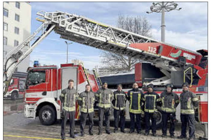
Eine neue Drehleiter bereichert seit Anfang 2025 den Fuhrpark der Freiwilligen Feuerwehr Kaufungen. Sie lässt sich computergestützt bedienen und verfügt über eine Leiter mit Knickgelenk.

fer, der bis zu 2000 Liter pro Minute abgibt. Eine computergestützte Steuerung sorgt für eine präzise und schnelle Positionierung der Leiter – besonders im hektischen Einsatzalltag von unschätzbarem Wert.