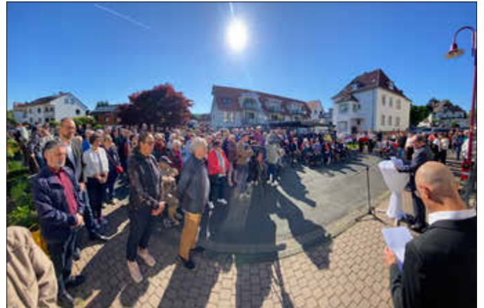
Rund 200 Gäste kamen zur Stolpersteinverlegung.

Die Idee für die Stolpersteine hatte der Künstler Gunter Demnig bereits im Jahr 1992: Die 96 x 96 x 100 Millimeter großen Messingplatten, die in einen Betonblock gegossen werden, markieren den letzten frei gewählten Wohnort der Betroffenen und beginnen stets mit den einleitenden Worten „Hier wohnte“.