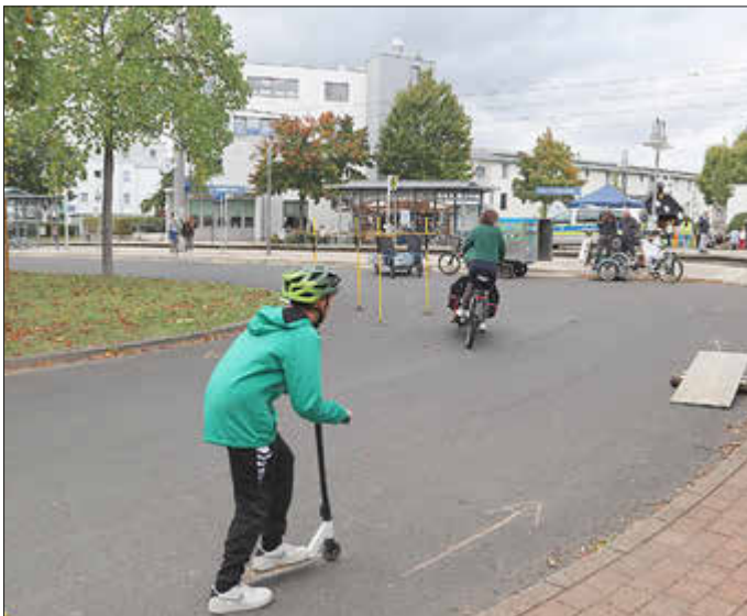
Der Lastenrad- und Fahrradparcours des Vereins Spurwechsel bot sportliche Herausforderung und Abwechslung.

Fußballbillard, eine bunte Hüpfburg, das Kinderkonzert von „Herr Müller und seine Gitarre“ sowie die faszinierende Jonglage- und Feuershow von Gerd dem Gaukler sorgten für leuchtende Kinderaugen.