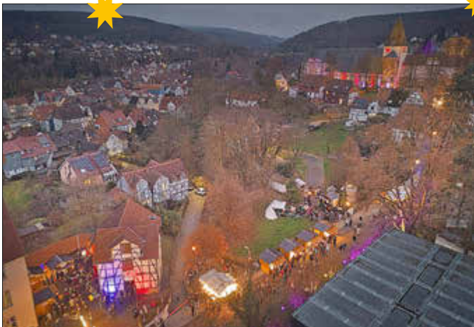
Das Stiftsweihnachtsgelände von oben.

Jelinek stellte fest: „Ich war erst vor kurzem in einer größeren Stadt, da gab es mehrere Weihnachtsmärkte. Aber ich kann Ihnen sagen - hier zuhause bei uns ist es viel schöner. Und das hat auch damit zu tun, dass Sie alle da sind.“ Sie richtete einen großen Dank vor allem an das Orga-Team der Stiftsweihnacht und alle anderen Mitwirkenden. „Es ist erst die 19. Stiftsweihnacht - und trotzdem kommt es uns vor, als gäbe es sie seit hundert und mehr Jahren“, sagte Bürgermeister