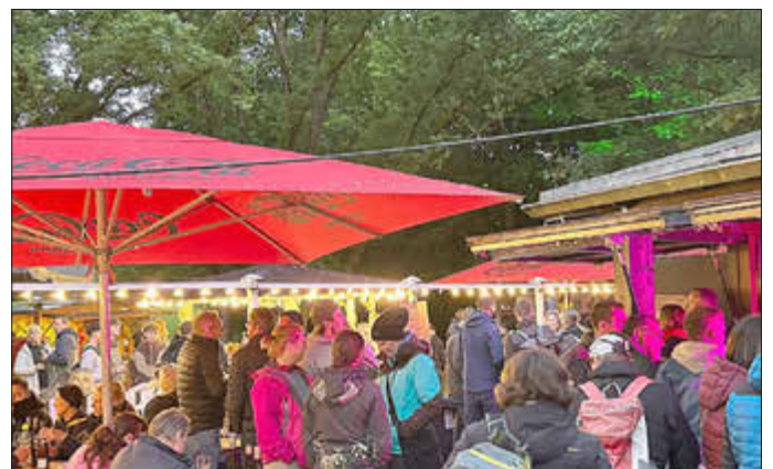
Trotz zahlreicher Regenschauer herrschte eine gute Stimmung.

Mit einer Auswahl an edlen Tropfen aus verschiedenen Weinregionen war für jeden Geschmack etwas dabei. Die Weinauswahl, die in diesem Jahr sowohl bekannte als auch neue Weingüter präsentierte, begeisterte die Gäste. Kulinarisch wurden die Besucher ebenfalls verwöhnt: Rudolph Gastronomie sorgte mit gegrillten Spezialitäten für den