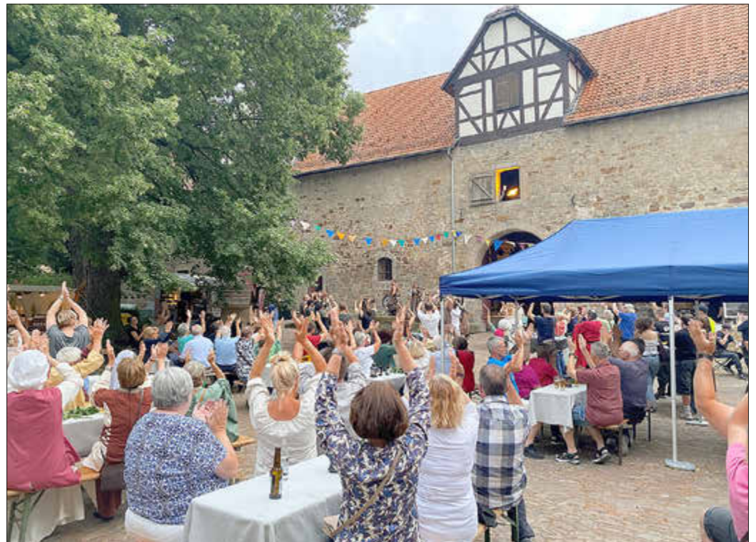
Das Publikum ist begeistert von der Darbietung von „Unvermeydbar“ im Stiftshof.