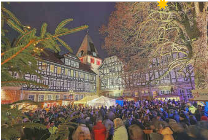
Zusammenkommen in wunderschöner Kulisse: Rund 25.000 Besucherinnen und Besucher kamen zur 19. Stiftsweihnacht in die Kunigundengemeinde.