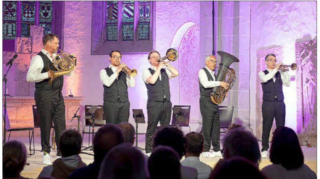
Im Juli 2025 war das weltberühmte Blechbläserquintett Canadian Brass zu Gast in Kaufungen.