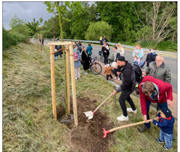
Ein symbolträchtiges Zeichen: Gemeinsam wird das Pflanzloch der neuen Roteiche für den Geburtenjahrgang 2025 mit Erde befüllt.