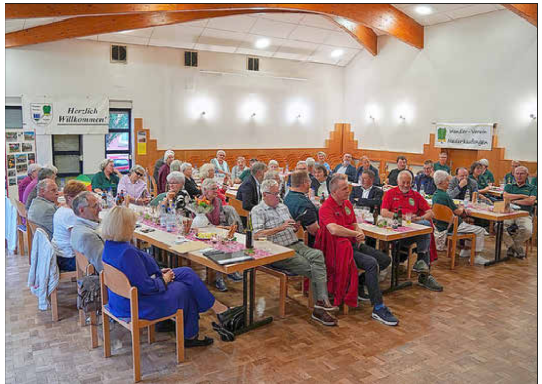
Interessiertes Publikum beim Jubiläum 75 Jahre Wanderverein Niederkaufungen.