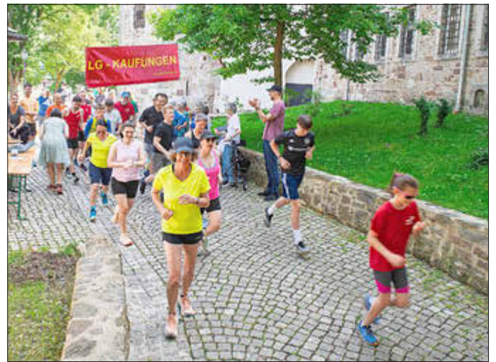
Startschuss zu 1000 Jahre, 1000 Runden.

Über eine Stunde lang kämpften die Läufer gegen die Hitze, während Zuschauer entlang der Strecke mit Wasser für Abkühlung sorgten. Der Lauf hob