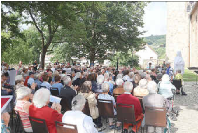
Rund 200 Menschen kamen zu der feierlichen Enthüllung.