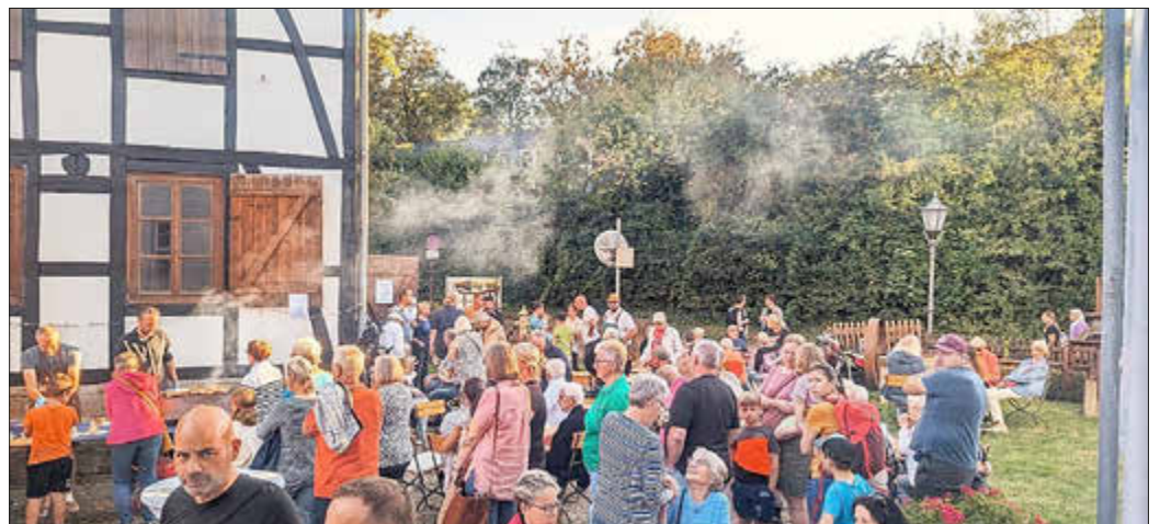
Fröhliches Treiben und Bratwurst essen auf dem Innenhof.