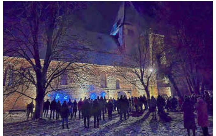
Die Lasershow stellte eine spannende Verbindung von Natur und Technik dar.

Ein tierischer Spaß für die ganze Familie: