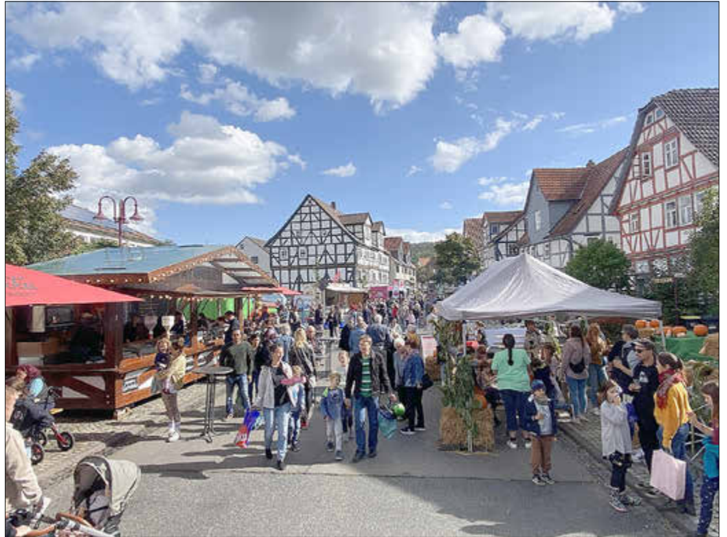
Die Leipziger Straße im goldenen Sonnenschein.

Zahlreiche Besucherinnen und Besucher aus Kaufungen und der Umgebung strömten bei goldenem Sonnenschein durch die Gassen und genossen die vielfältigen Angebote. Schon von weitem wurden Besucher durch den Duft von frisch gegrillter Bratwurst, süßen Crêpes und frischen Donuts angelockt. Der Klang fröhlicher Live-Musik sorgte an beiden Tagen für eine lebendige Stimmung. Ein großes Highlight war das Kürbisschnitzen, welches sowohl Kinder als auch Erwachsene begeisterte. Mit viel Kreativität entstanden fröhliche Kürbisgesichter, die dem