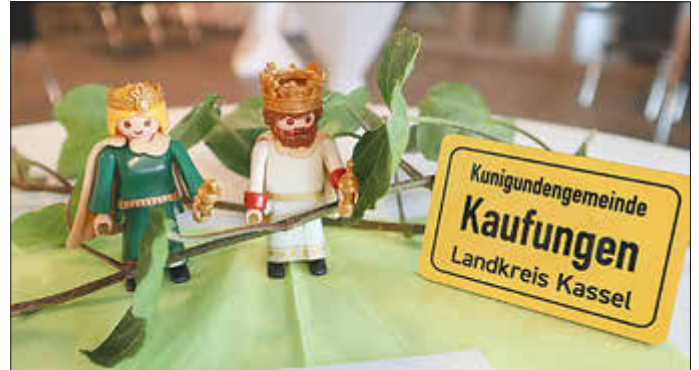
Kaiserin Kunigunde und Kaiser Heinrich II. im Playmobilformat neben dem neuen Ortsschild in Form eines Kühlschranks.

Von den 421 Städten und Gemeinden des Bundeslandes ist Kaufungen die erste Kommune, die eine Zusatzbezeichnung zu Ehren einer Frau trägt. „Kaufungen übernimmt damit eine Vorreiterrolle: Wir rücken eine historische Frauengestalt ins Zentrum, die prägend für die Geschichte und Entwicklung Kaufungens ist“, so Bürgermeister Roß.