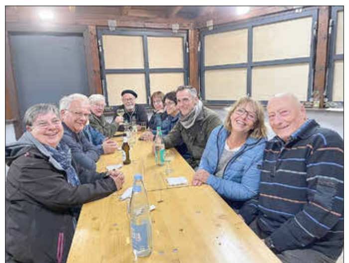
Auch das gesellige Kennenlernen kam an diesem Wochenende nicht zu kurz.