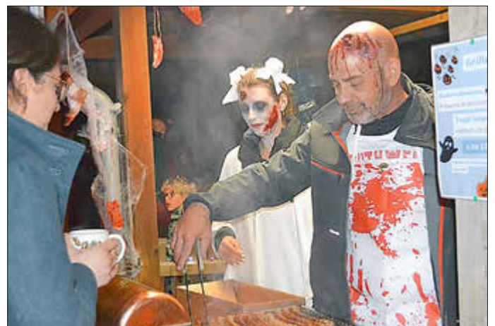
Der Verein Zeitsprung sorgte für die Bewirtung.

beim Crêpes backen, Gläser spülen oder dem Verkauf.