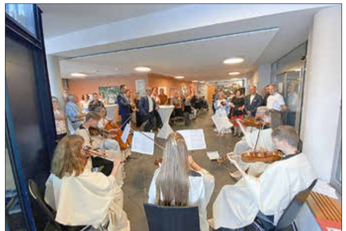
Feierliche Musik durch das Streicher-Ensemble der Musikschule Söhre-Kaufunger Wald.

Die feierliche Verleihung im Rathausfoyer wurde musikalisch von der Musikschule Söhre-Kaufunger Wald umrahmt.