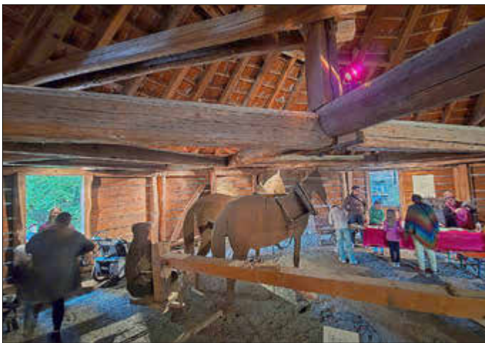
Bastelstunde mit Kids im Bergwerkmuseum.

Zur Eröffnung des Bergwerk-museums Rossgang 2025 wurden sogar vier echte Bergleute in Ausgehtracht von dem Chor Haste Töne mit „ihrem“ Steigerlied begrüßt. Sie sind gern in Verbundenheit aus Borken nach Kaufungen gekommen. Früher wurde ja an beiden Standorten Braunkohle abgebaut. In Borken war es schon ein bisschen mehr, das Kraftwerk musste ja gefüttert werden.