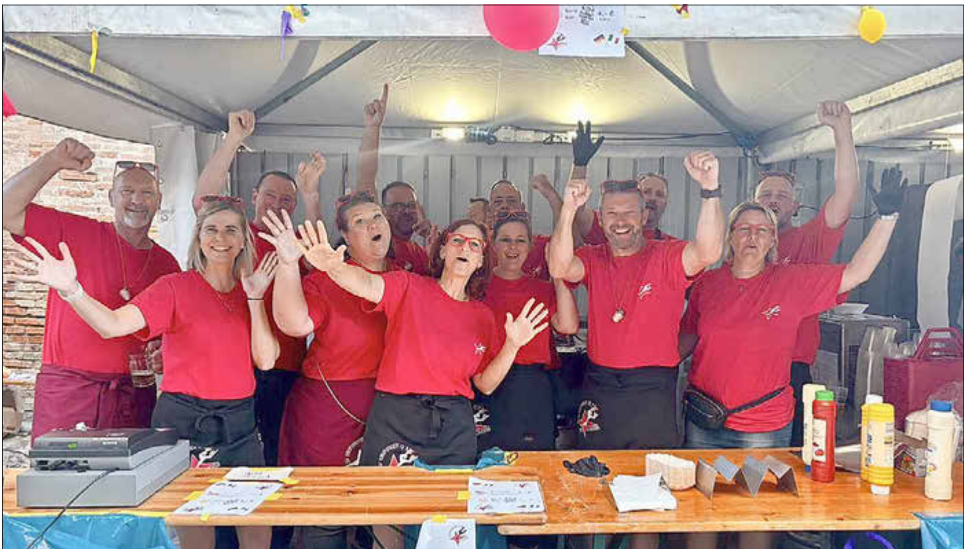
Die Lossesterne organisierten den diesjährigen Stand für Kaufungen und begeisterten mit guter Laune und originellen Späßen.