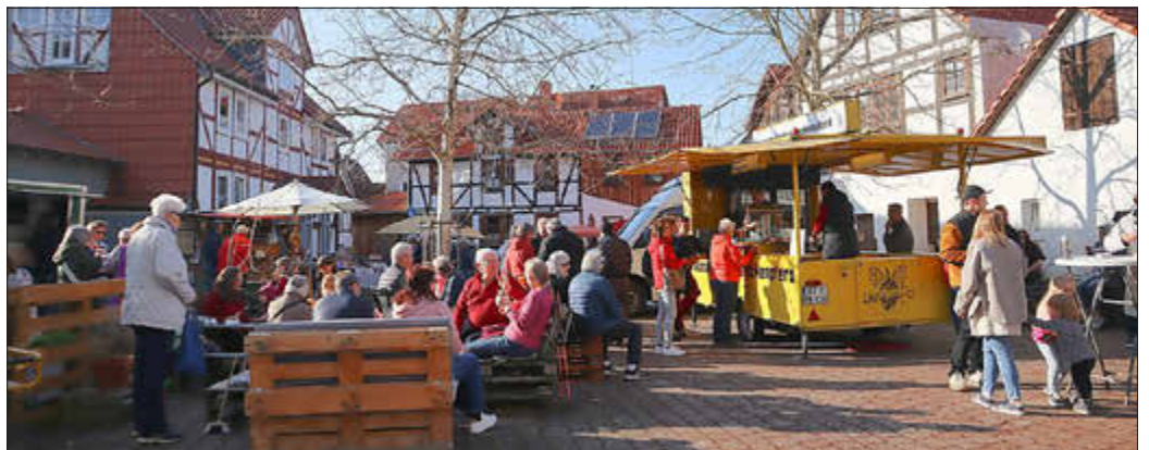
Gemütliches Zusammensitzen auf dem Brauplatz.