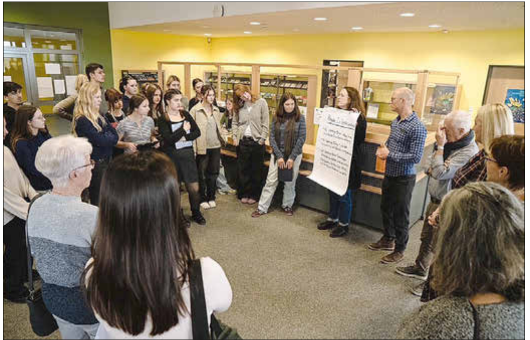
Zu Beginn werden die Regeln für die „Lebendige Bibliothek“ besprochen.

Warum verlassen Menschen ihre Heimat und fangen woanders ganz neu an? Welche Gründe und Wege Menschen aus verschiedenen Ländern und zu verschiedenen Zeiten nach Kaufungen geführt haben, erfuhren 24 Schülerinnen und Schüler der Klasse 10b der IGS Kaufungen im Rahmen eines Projekts am 5. November 2025 hautnah. In kleinen Gruppen kamen sie mit fünf Frauen und einem Mann ins Gespräch, die bereit waren, ihre Lebensgeschichten zu erzählen und Fragen der Jugendlichen zu beantworten. Die Veranstaltung war als „Lebendige Bibliothek“ organisiert, in der man sich Menschen als „Lebende Bücher“ für ein Gespräch „ausleihen“ kann. Nach jeweils 20 Minuten wechselten die Gesprächspartner.