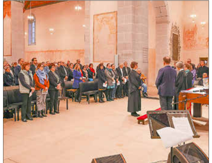
Die neue Inhaberin der Dekansstelle wurde gesegnet.

gewinnbringende, lebendige und zupackende Persönlichkeit vor: „Als leidenschaftliche Gemeindepfarrerinnen hast du eine vielseitige Begabung gezeigt, die wir in der Leitung brauchen. Willkommen - Du hast uns gerade noch gefehlt mit deiner