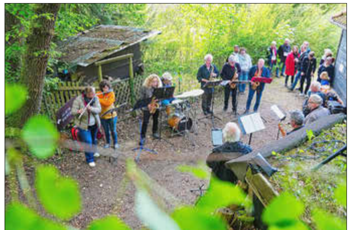
Vereint. MIK Saxophon Ensemble Kassel und Saxophon Ensemble Söhre Kaufunger Wald.