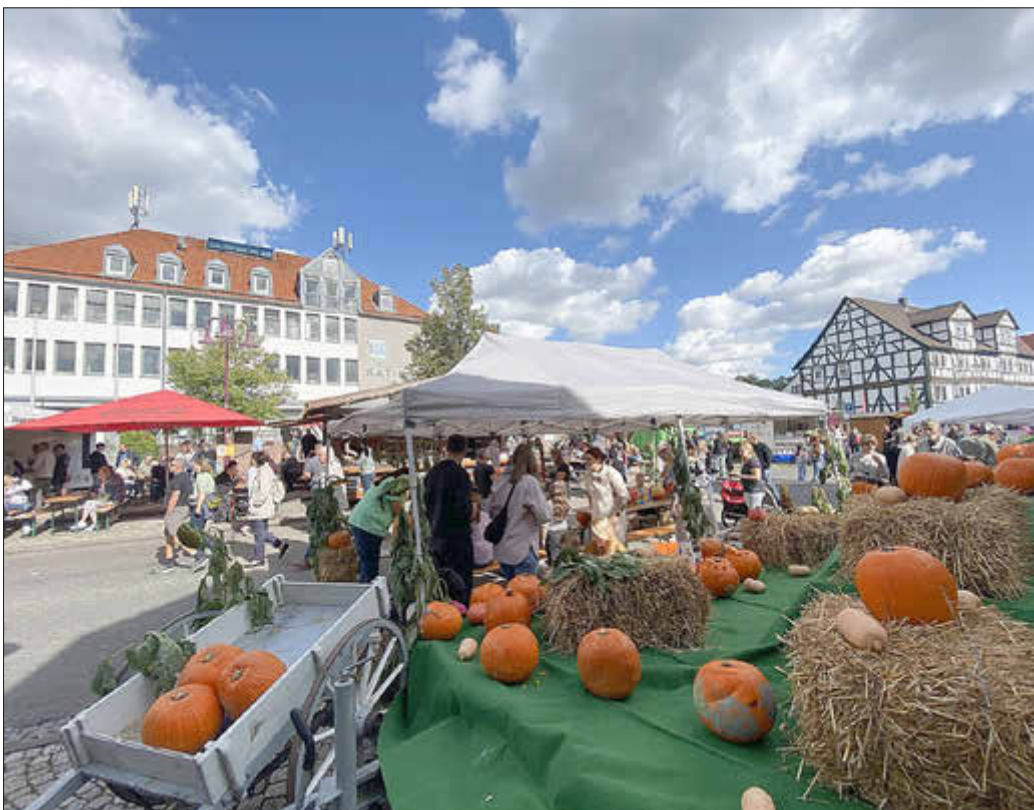
Großes Highlight - das Kürbisschnitzen.

Markt ein herbstliches Ambiente schenken. An den vielen Ständen mit liebevoll gefertigter Handarbeit fanden die Besucher besondere Schätze und Geschenkideen. Das Kasseler Kollektiv präsentierte seine Ausstellung zur Geschichte von Mila O. und feierte dabei sein 11¾-jähriges Jubiläum. Mit ausgewählten Produkten und einer Siebdruck-Aktion entstand auf dem Brauplatz ein bunter Blickfang, der viele Gäste anzog. Mit seiner Mischung aus regionalen Spezialitäten, Musik und Mitmachangeboten erlebte der Herbstmarkt ein fröhliches Miteinander in der Gemeinde.