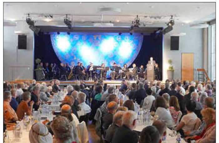
Rund 300 Gäste kamen zum gemeindlichen Empfang „1000 Jahre Stiftskirche“.