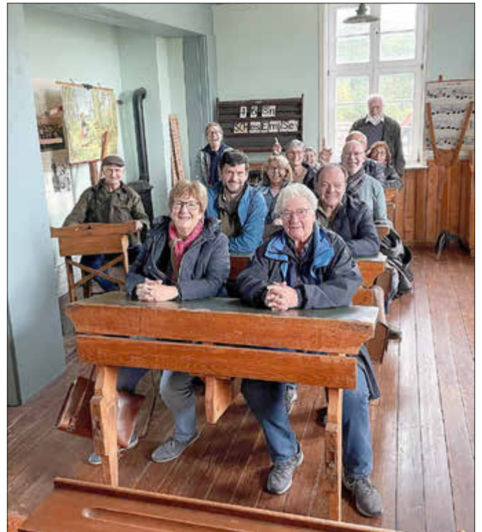
Mit viel Spaß nahmen die französischen Gäste in den Schulbänken des Regionalmuseums Platz.