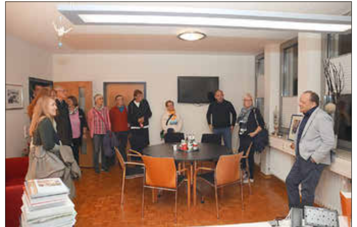
Bei einer Führung durch das Rathaus erfuhren die Teilnehmenden unter anderem, dass das jetzige Bürgermeisterbüro früher der Sitzungssaal des Gemeindevorstands war.

Nach dem offiziellen Teil öffneten sich die Türen zu den Schaltzentralen der Kunigundengemeinde – und luden die Gäste zu einem besonderen Rundgang ein: durch das Rathaus, den Bauhof und das Jugendzentrum. Wo sonst Entscheidungen getroffen, Anträge geprüft oder Baupläne gewälzt werden, konnten Inte-