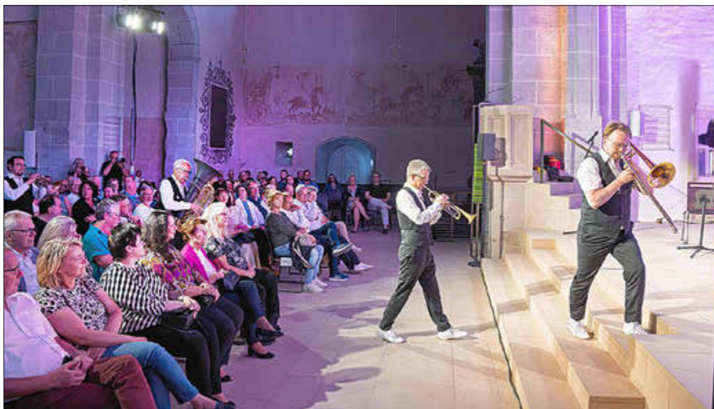
Mittendrin statt nur dabei: Canadian Brass interagieren mit dem Publikum in der Stiftskirche.