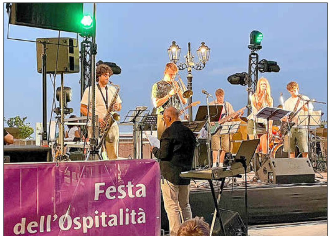
„Rock E 45“, das gemeinsame Musikprojekt von Jugendlichen aus Kaufungen und Bertinoro überzeugte mit gesanglicher und instrumenteller Qualität.