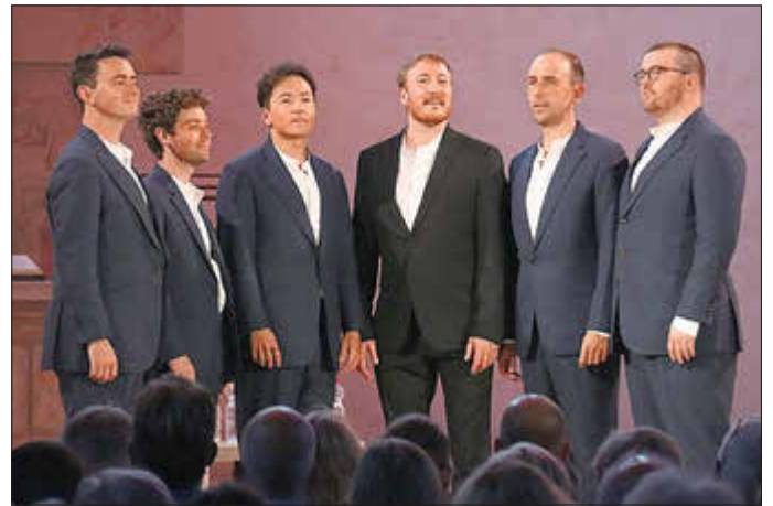
Verwandelten am 18. Juni die Stiftskirche in ein Zentrum feinsten A-cappella-Kunst: Die „King's Singers“ aus London.

Das ausverkaufte Konzert, das von der Wirtschafts- und Infrastrukturbank Hessen (WI-Bank) gefördert wurde, endete mit einem kräftigen Applaus, zwei Zugaben und Standing Ovations – ein Zeichen dafür, wie sehr die King's Singers nicht nur mit ihren Stimmen, sondern mit ihrer ganzen musikalischen Persönlichkeit das Publikum berührt haben.