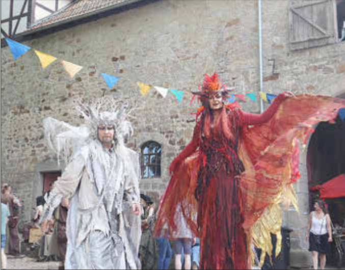
Verzauberten die Besuchenden: Die Stelzenläufer von INCANTO.

Wenn der Duft von Met, frisch gebackenem Brot und Feuer in der Luft liegt, dann weiß man: Kaufungen ist zurück im Mittelalter. Am 5. und 6. Juli verwandelte sich der Stiftshof in eine schillernde Bühne für Ritter, Gaukler, Mägde und allerlei Volk – das Mittelalterfest 2025, veranstaltet von der Gemeinde Kaufungen, dem Mittelalterverein Coufunga und der Kirchengemeinde Oberkaufungen, wurde zu einem Erlebnis für Jung und Alt.