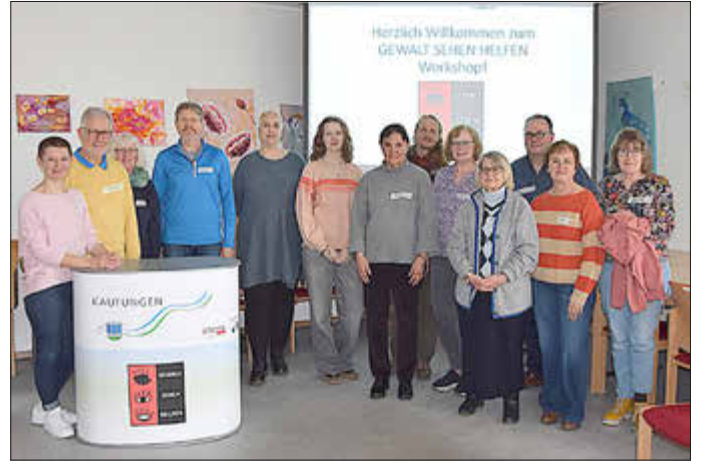
9 Frauen und 2 Männer nahmen an dem Workshop teil und gehen gestärkt in ihrer Wahrnehmung und Handlungsfähigkeit ins öffentliche Leben

Anhand von verschiedenen Rollenspielen, in denen die Anleitenden großes Schauspielpotential zeigten, wurde auf die Aspekte verbaler und kör-