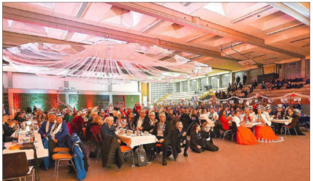
Gastgeber in der IGS-Sporthalle. Gastgeber waren in dieser Session die Karneval- und Tanzsportgemeinschaft „Die Lossesterne“.