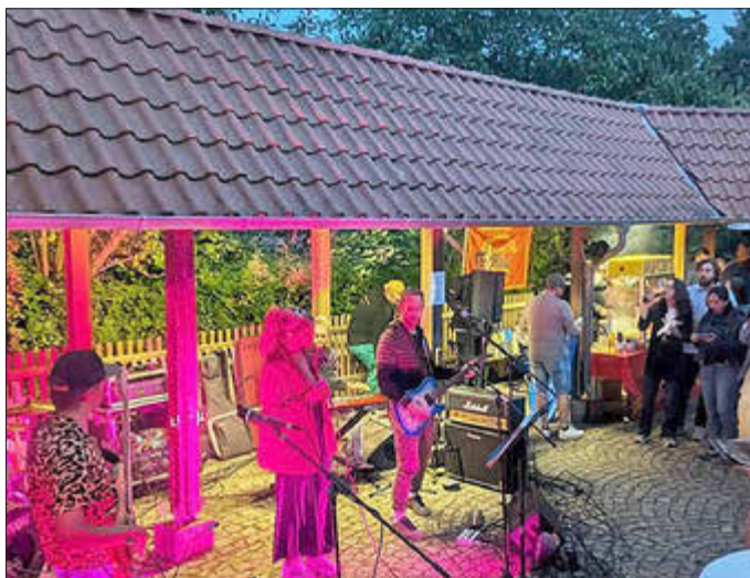
Die Band „Five Eight“ leitet musikalisch den Abend ein.

„Die Mischung aus der Playmobil-Ausstellung, Diashow und Musik gestaltete den Abend im Regionalmuseum sehr vielfältig und einzigartig“, erzählte ein Besucher der Museumsnacht.