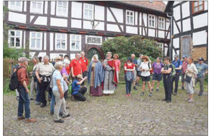
Empfang durch das Kaiserpaar in der Stiftsgemeinde Freiheit.