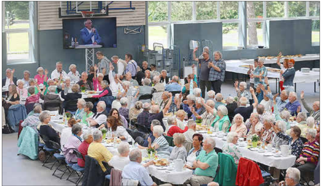
Ausgelassene Stimmung an den „Kaufunger Tischen“.