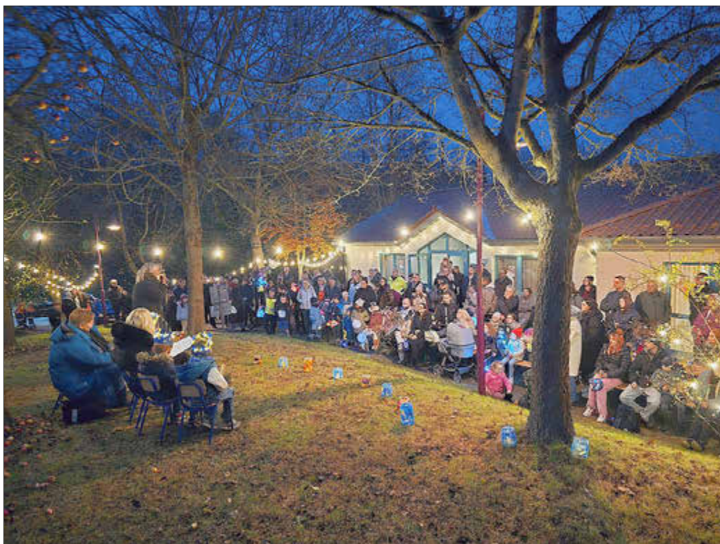
Das Orga-Team freut sich über so viele Menschen.

Die Stimmung war toll, man lernte sich besser kennen „Wo wohnen sie denn in Papierfabrik?“ Es gab auch noch viel zu erzählen.