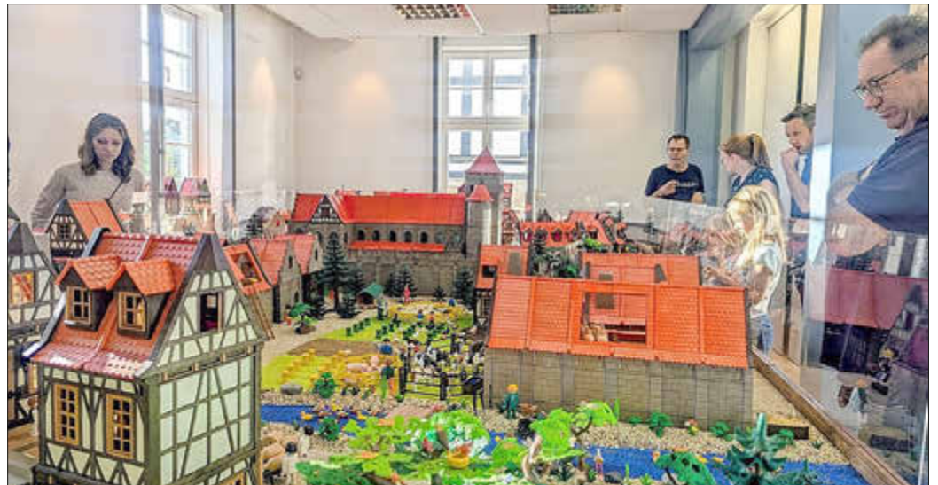
Das nachgebaute historische Ortsbild aus Playmobil.