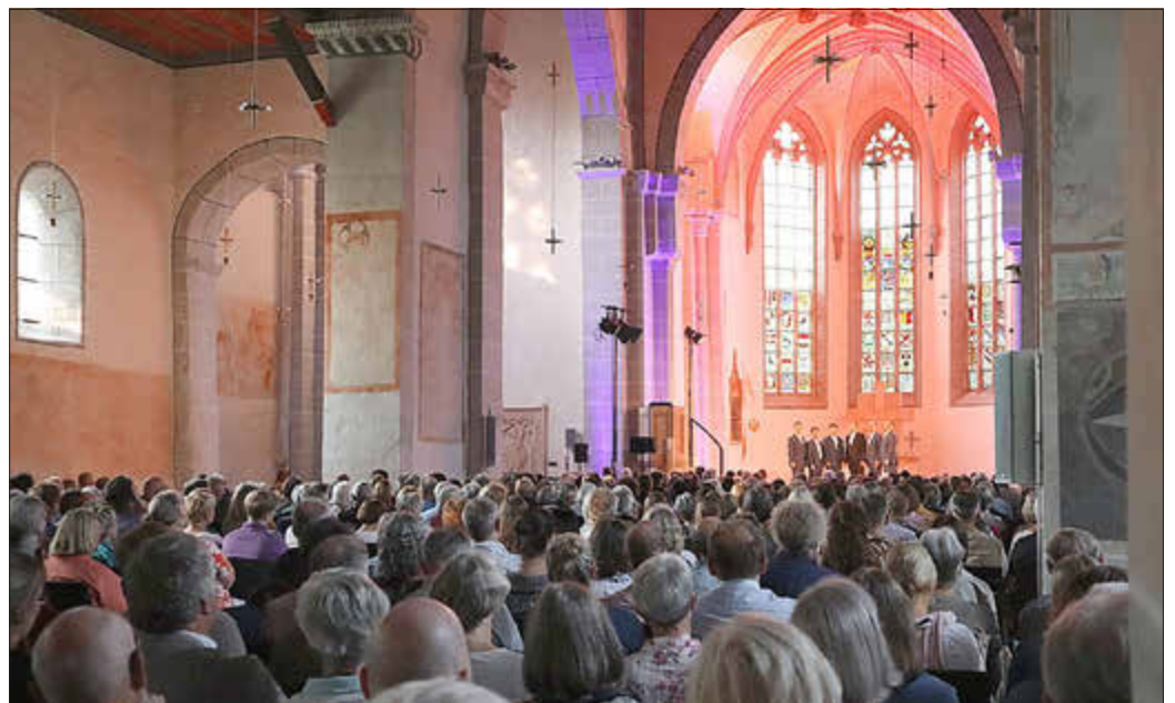
Die Londoner Künstler begeisterten mit makelloser Intonation und britischem Charme in der ausverkauften Stiftskirche.