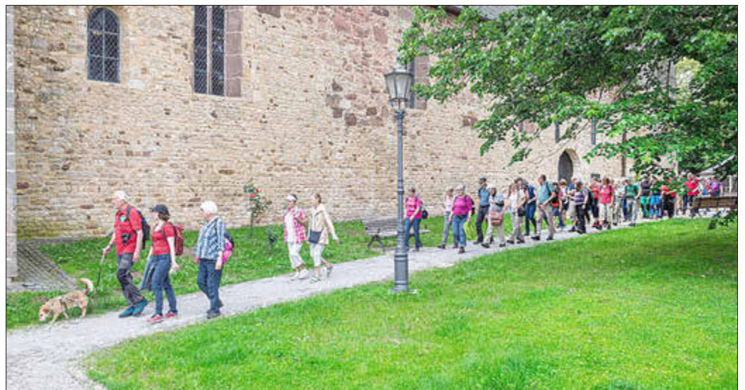
Los ging es für 75 Teilnehmende.