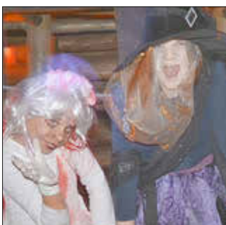
Gruselige Gestalten im Stollen.

Ungefähr 500 kleine und große Menschen kamen im Oktober 2025 zur Halloweenparty ins Regionalmuseum. Das Team des Vereins Zeitsprung hatte bereits im Vorfeld viel Zeit und Mühe aufgebracht und alle am Abend genutzten Areale des Museum in ein schauriges Kleid gehüllt.