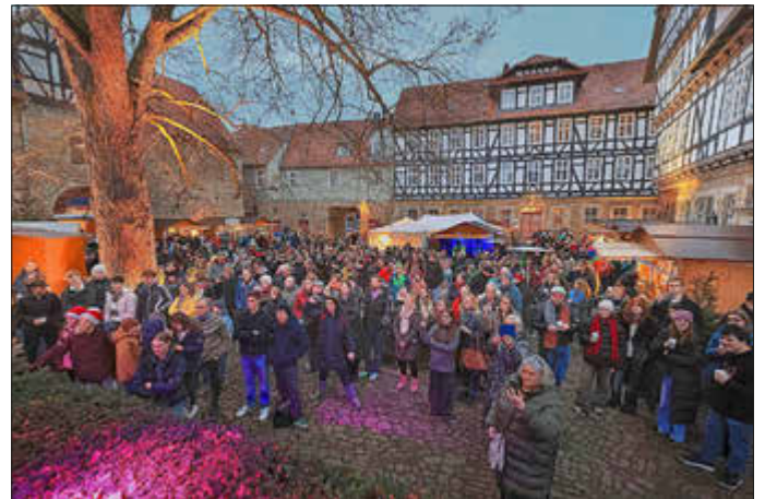
Vor der Bühne im Stiftshof verfolgten zahlreiche Gäste das bunte Musikprogramm.