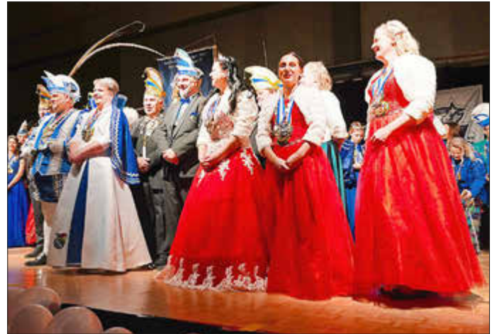
Karnevalistische Hoheiten auf der Bühne.