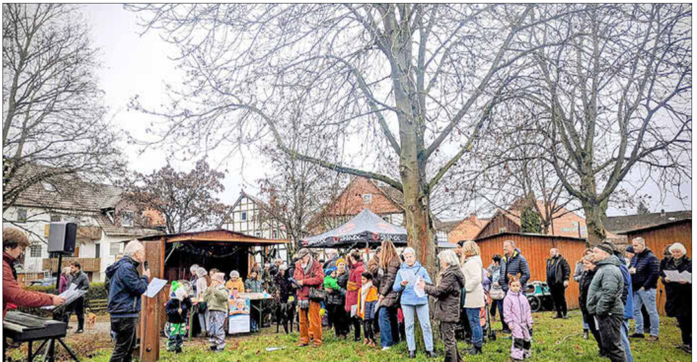
Gemeinsames Advents- und Weihnachtsliedersingen.