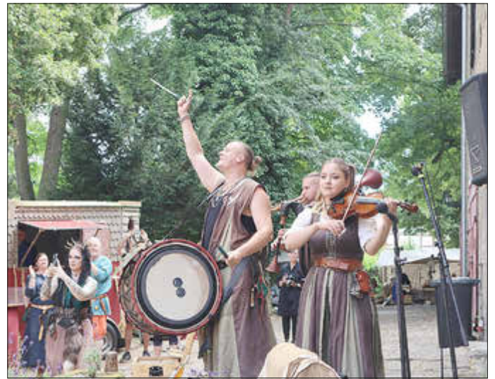
Rockten mit Dudelsack, Geige und Trommeln das Mittelalterfest: „Unvermeydbar“ aus Kassel.

Künstler und vor allem an die Besucherinnen und Besucher, die das Mittelalter mit Leben gefüllt haben.“ Das Fest habe gezeigt, wie lebendig die Verbindung zwischen Kunigunde, Kaufungen und der Stiftskirche ist – ein gelebtes Stück Geschichte.