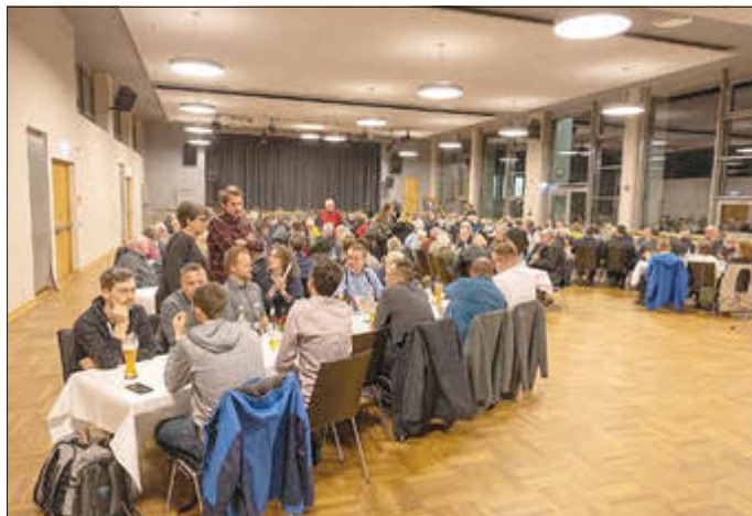
Volles Haus: Mit einem Ehrenamtsabend zum Stiftskirchenjubiläum würdigten die Obervorsteher des Ritterschaftlichen Stiftes Kaufungen all jene, die sich in Kaufungen ehrenamtlich engagieren.

Einladung der Obervorsteher des Stiftes versammelten sich Ehrenamtliche aus den unterschiedlichsten gemeinnützigen Vereinen der Gemeinde, um im Rahmen des 1000-jährigen Jubiläums der Stiftskirche einen besonderen Dank entgegenzunehmen.