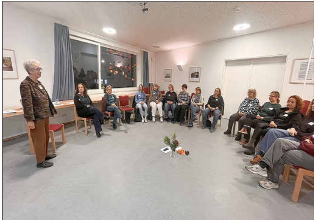
Es gab viel Zeit zum Austausch in der Gruppe.

65 Prozent der Vorstandspeditionen in Vereinen in Deutschland sind mit Männern besetzt. Eine Zahl, die Fragen aufwirft. Christiane Eiche zeigte mögliche Gründe dafür auf: Frauen verzichten zum Beispiel öfter auf diese zeitaufwändigen Führungspositionen, da sie familiär stärker gefordert sind, etwa in