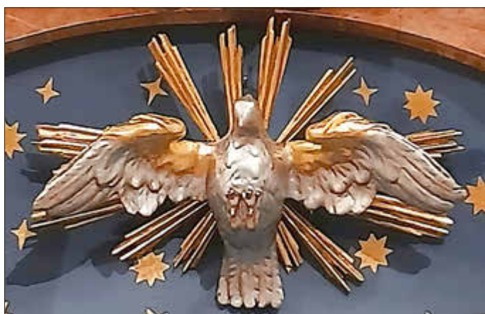
Symbolik des Heiligen Geistes in unserer Pfarrkirche