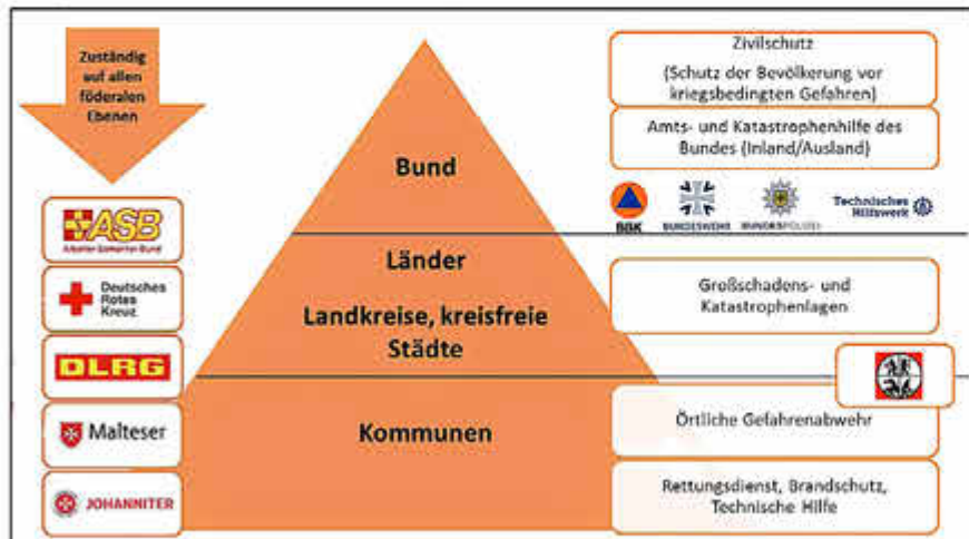
Integriertes Hilfeleistungssystem im föderalen Bundesstaat

Genau das macht die Gemeinde zu einer so zentralen Größe im Bevölkerungsschutz. Wir sind keine Zuschauer, die darauf warten, dass Bund oder Land handeln. Wir sind Teil des Systems – und oft der erste Ansprechpartner, wenn etwas passiert. Wir koordinieren die Feuerwehren, stimmen uns mit dem Landkreis Fulda und dem Land Hessen ab, erstellen Notfallchecklisten für bestimmte Bereiche vor Ort und sorgen dafür, dass Sie als Bürgerinnen und Bürger im Ernstfall schnell und verlässlich informiert werden.