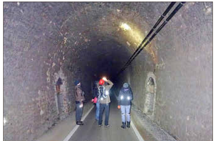
Kontrolle im Milseburgtunnel (Archivfoto). Der Milseburgtunnel ist das wichtigste Fledermaus-Winterquartier in der hessischen Rhön.

Ausführliche Infos rund um den Fledermausschutz im Landkreis Fulda finden Interessierte auf www.fledermausschutz-fulda.de .