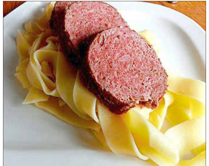
Flurgönder mit Nudeln und Salat 11,00 €

Wir freuen uns auf einen geselligen Tag mit euch.