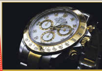
Luxusuhren, Ankauf Rolex, Breitling, Cartier, IWC, Omega...

Exklusives Eröffnungsangebot Kostenfreie Bewertung ihrer Schmuckstücke, Uhren oder Edelmetalle + SOFORTIGE BARAUSSZAHLUNG zum fairen Tagespreis!