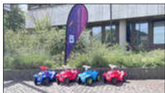
Die von Mitarbeitenden gespendeten BobbyCars

Jugendamt und Gesundheitsamt des Saarpfalz-Kreises informieren beim Stadtfest der Inklusion am 13. Juni über ihre Beratungsangebote. Mitarbeitende der Bereiche Frühe Hilfen, Sozialpsychiatrischer Dienst, Klima & Gesundheit, Jugendamt sowie Verfahrensnot- ständen in der Talstraße gegenüber dem Christian-Weber-Platz für Fragen und persönliche Gespräche zur Verfügung. Besucherinnen und Besucher erhalten dort Informationen zu den unterschiedlichen Unterstützungsangeboten des Saarpfalz-Kreises und können sich individuell beraten lassen. Ergänzend laden verschiedene Mitmachaktionen dazu ein, miteinander ins Gespräch zu kommen.