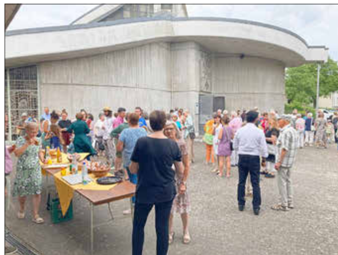
Empfang auf dem Kirchenvorplatz

Wo bin ich mit meinen Gedanken? Bei dem, was gestern war? Was mich gekränkt hat? Was ich falsch gemacht habe? Bei dem, was morgen sein wird? Was mir Sorgen macht? Was passieren könnte? So viel Unrast! Zu viel Unrast! Stopp! So nicht weiter! Zur Ruhe kommen, Vergangenes und Zukünftiges loslassen. Meine Gedanken zurückholen in die Gegenwart. Mich vorbehaltlos einlassen auf gerade diesen Augenblick. Jetzt.