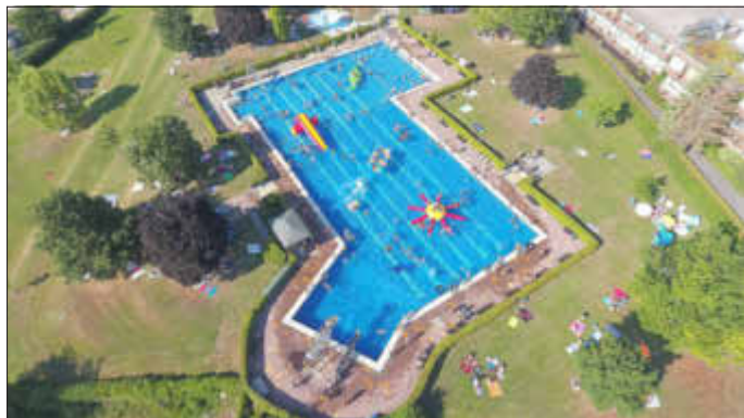
Freibad Bad Sooden-Allendorf

Interessierte können sich direkt im Freibad Bad Sooden-Allendorf beim Schwimmmeister Thomas Werner unter 05652 4057 melden. Der Förderverein freut sich über viele Rückmeldungen!