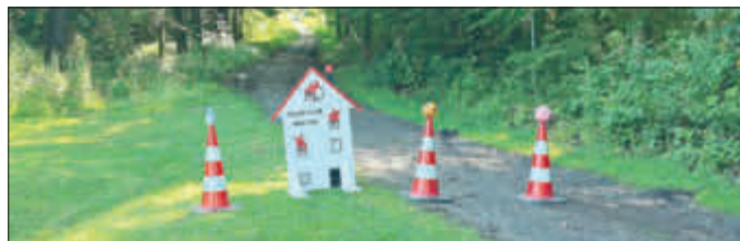
Wasser marsch, bitte!