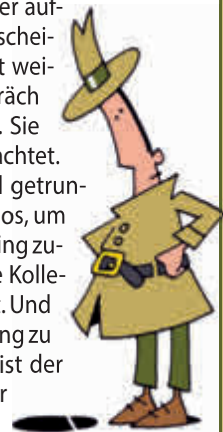
Illustration: © Dieter Hermenau/DEIKE

Lösung „Tödliches Ultimatum“: Urs Molling. Er hat das Haus um 20 Uhr verlassen, weiß aber dennoch, dass Lydia und Enno später noch getrunken haben.