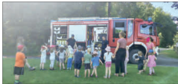
ganz gebannte Zuhörer/innen