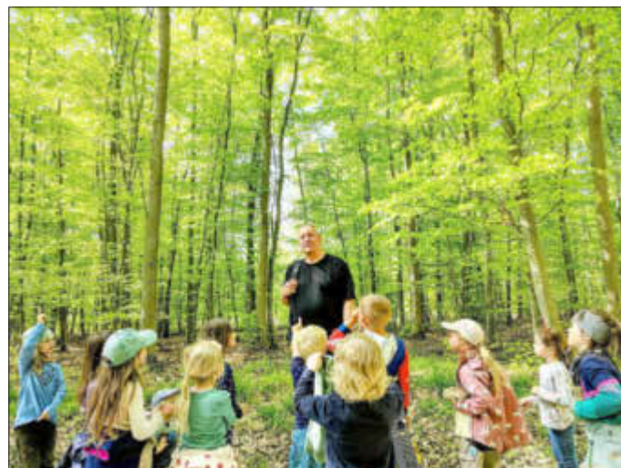
Gefesselt lauschen die Kinder dem Erzähler

„Märchen öffnen Türen zu einer Welt voller Wunder.“