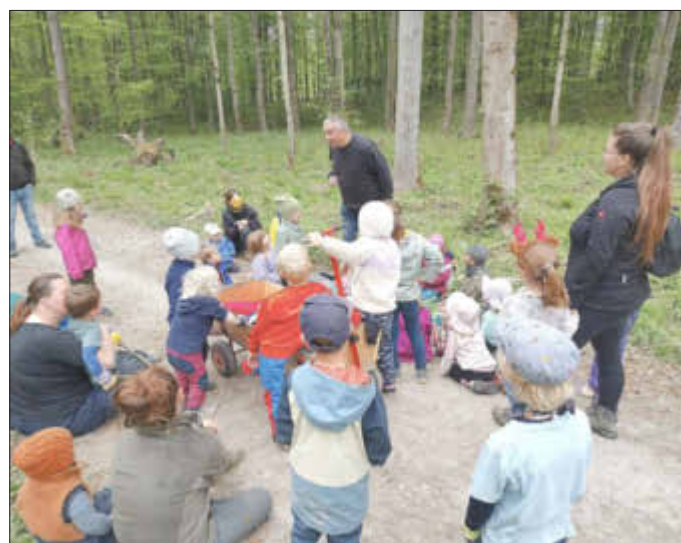
Märchen erzählen mitten im Wald