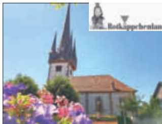
Evangelische Kirche Oberauala

Schnizer, Telemann und anderen. https://www.rotkaeppchenland.de/veranstaltungen#/eventDate/a02263f5-bfe7-46f8-ac09-4524f1cf7fbc https://www.rotkaeppchenland.de/veranstaltungen#/eventDate/a01237ce-1420-4faa-afd7-ea1e49846166