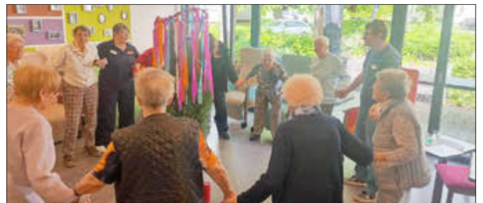
Tanz um den gemeinsam gestalteten Maibaum in der ASB Tagespflege

Mit viel Kreativität, Bewegung und guter Laune hat die ASB-Tagespflege Baunatal den „Aktionsmonat Mai“ gefeiert. Im Mittelpunkt stand dabei ein selbst gestalteter Maibaum, der gemeinsam von Seniorinnen, Senioren und Mitarbeitenden liebevoll dekoriert und aufgestellt wurde. Dieses Projekt bildete den Auftakt für eine abwechslungsreiche Woche voller Aktivitäten. Begleitet von Musik und Tanz nutzten die Teilnehmenden die fröhliche Atmosphäre, um nicht nur den Frühling zu begrüßen, sondern auch aktiv etwas für ihre Gesundheit zu tun. Durch gezielte Bewegungsangebote wurden motorische Fähigkeiten alltagsnah gefördert – etwa durch Tanzeinlagen, rhythmische Übungen und kleine Koordinationsspiele.