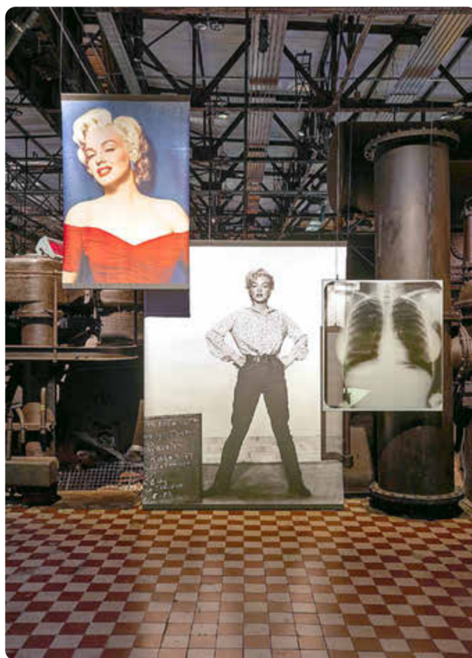
Blick in die Ausstellung „X-RAY“. Selbst eine Röntgenaufnahme von Marilyn Monroe wurde nach ihrem Tod zum hoch gehandelten Fetischobjekt.

Nach der Begrüßung durch eine eigens für die Schau