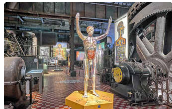
Der „Gläserne Mensch“ ist ein wichtiges Zeugnis des Röntgenblicks. Gläserner Mann, 1992, überarbeitet 2014 nach dem Original von Franz Tschackert (1930), Stiftung Deutsches Hygiene-Museum, Dresden.

toph Brech die konkreten Folgen von Industriearbeit. Das eigens für die Gebläsehalle realisierte Rundbogenfenster zeigt Röntgenaufnahmen von Lungen – von Menschen, die einst in und um die Völklinger Hütte arbeiteten. Nicht wenige zeigen Anzeichen einer Staublungenerkrankung oder eines Karzinoms. Das Fenster erinnert so eindringlich und exemplarisch an alle Menschen, die hier unter schwersten Bedingungen im Staub der Schornsteine und Sinteranlage gearbeitet haben.