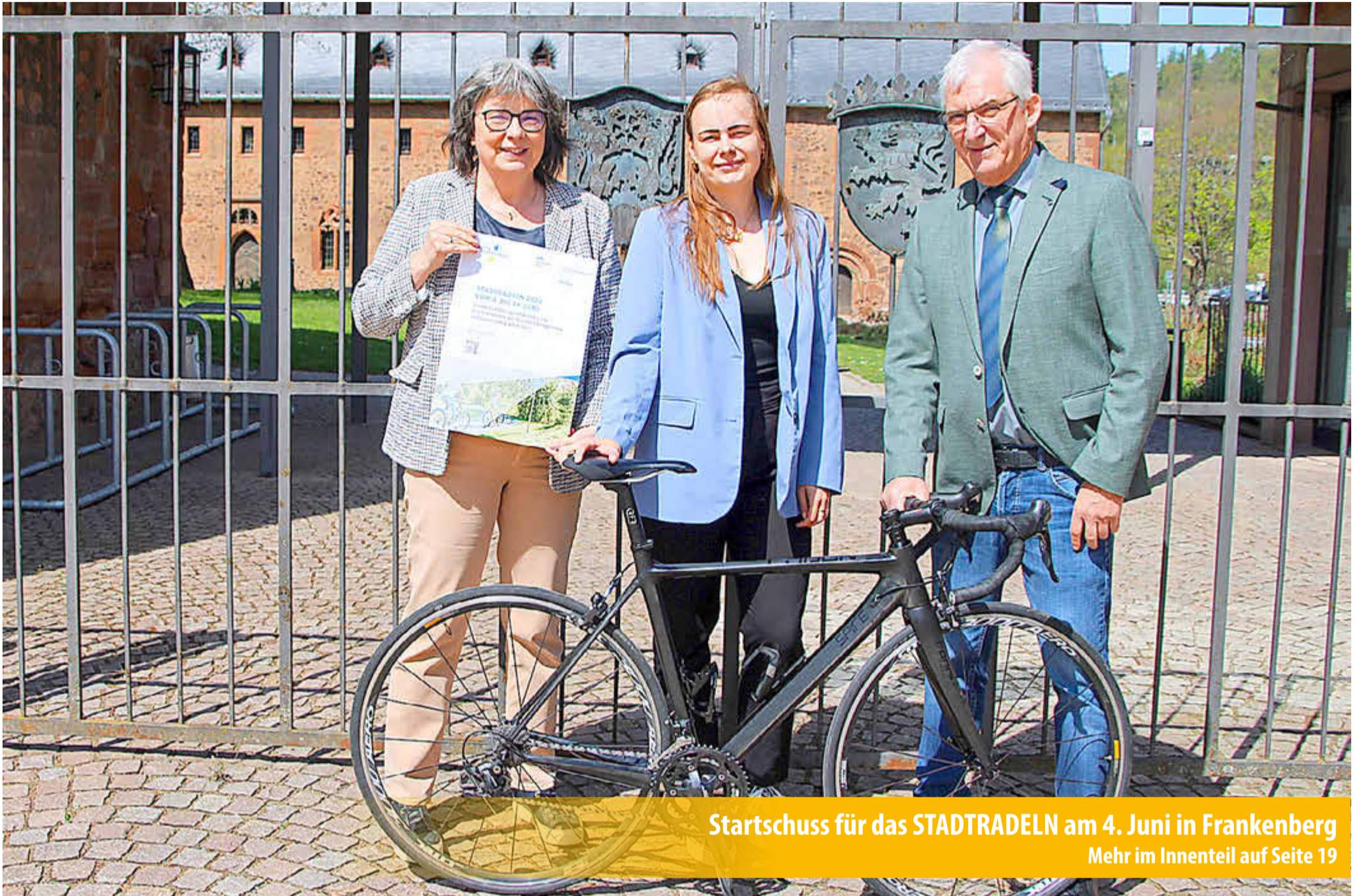
Startschuss für das STADTRADELN am 4. Juni in Frankenberg Mehr im Innenteil auf Seite 19