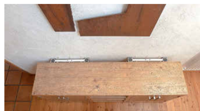
Frischluft bis in jede Ecke: Mit einer steten Luftzirkulation hinter Schränken und Regalen lässt sich der Schimmelgefahr wirksam vorbeugen.

zwischen der Rückseite des Schrankes und der Wand ein-klemmen lässt, zum Betrieb reichen eine Haushaltssteckdose und eine Zeitschaltuhr