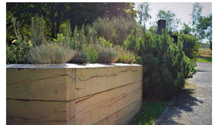
Heilkräuter-Hochbeet als Grabvariante