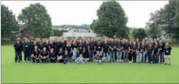
Die Tuspo-Familie: Alle Helfer und das Orga-Team

Das Orga-Team hatte alles bestens vorbereitet und zusätzlich ca. 70 Helferinnen und Helfer sorgten für einen reibungslosen Ablauf.