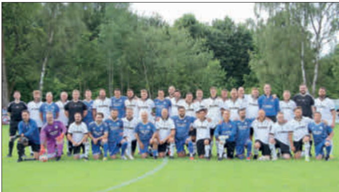
Schalke 04 Traditionself und die Tuspo Nieste All-Stars