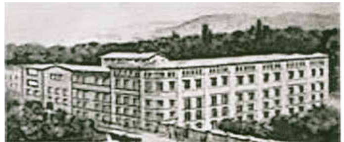
Fabrik Askonas in Asch

1946 begann dann eine nie für möglich gehaltene, so genannte Ausweisung der deutschen Bevölkerung aus dem Gebiet der Tschechoslowakei. Nach tschechischem Sprachgebrauch erfolgte „Odsun“ - eine zwangsweise Evakuierung. Über drei Millionen Menschen waren im Sudetenland davon betroffen. Begleitet von erneut unzähligen Opfern begann der Weg aus der seit Jahrhunderten angestammten Heimat in eine ungewisse Zukunft, die für viele hier in Spangenberg und der näheren Umgebung endete.