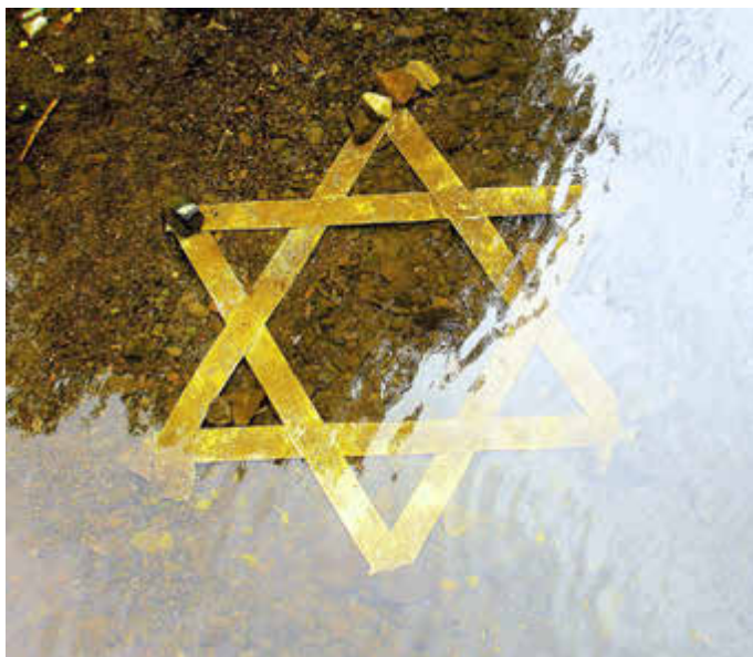
„Davidstern – versunkene und überspülte Erinnerung“ von Hiltraud Peterova

Die seit Jahrhunderten nur wenigen Veränderungen der Innenstadt machen Fritzlar ganz besonders, Liebhaber historischer Städte dürfen sich daher auf einen intensiven, erlebnisreichen Rundgang freuen.