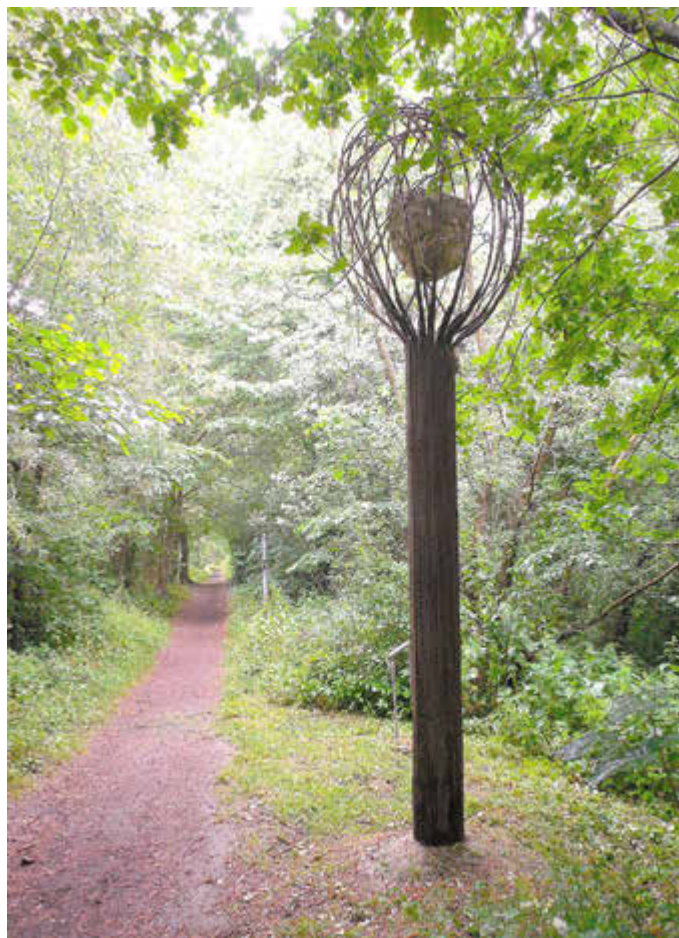
„Der Weltenbaum“ von Peter Paul Medzech

Peter Paul Medzech aus Minden schuf den „Weltenbaum“. Ist es die nordische Yggdrasill oder die sächsische Irminsul, die hier gemeint ist? Die Bäume verkörperten den gesamten Kosmos, symbolisierten die verschiedenen Sphären der Existenz; Weisheit und Verstand sollen in ihren Wurzeln verborgen sein. Im Zuge der häufig gewalttätigen Missionierung Germaniens fielen fast alle heiligen Bäume und Haine der Axt zum Opfer.