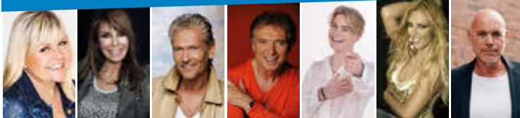
Gaby Baginsky, Ireen Sheer, Olaf Berger, Peter Orloff, Vincent Gross, Loona und Olaf Henning