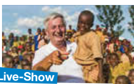
Live-Show mit Reiner Meutsch