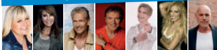
Gaby Baginsky, Ireen Sheer, Olaf Berger, Peter Orloff, Vincent Gross, Loona und Olaf Henning