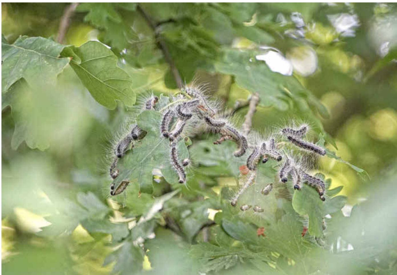
Gefährlich für Mensch und Tier: Der Eichenprozessionsspinner ist im Wald am Bühl bei Ahnatal und am Hohen Dörnberg gesichtet und fachgerecht entsorgt worden.

Der Eichenprozessionsspinner ist ein Nachtfalter, dessen Raupen vor allem Eichen befallen. Problematisch sind insbesondere die feinen Brennhaare der Raupen. Diese enthalten ein Nesseltgift und können bereits durch den Wind verbreitet werden. Ein Kontakt kann bei Menschen und Tieren gesundheitliche Beschwerden wie Hautausschläge, starken Juckreiz, Augenreizungen oder Atemwegsbeschwerden verursachen. Die Brennhaare bleiben zudem über einen langen Zeitraum wirksam und können auch in verlassenen Nestern noch gesundheitliche Reaktionen auslösen.