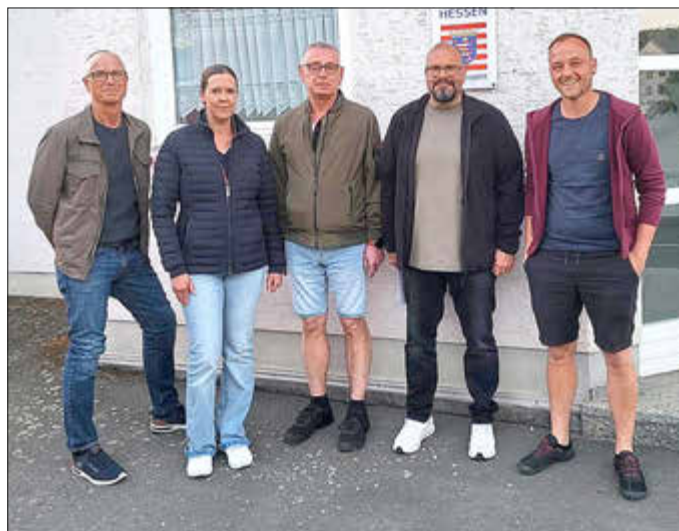
Der neue Ortsbeirat in Halsdorf.

Auch der neu gewählte Ortsbeirat nahm unmittelbar seine inhaltliche Arbeit auf. Dabei wurde unter anderem ein Aktionstag für den 12. September terminiert. Der nächste Sitzungstermin wurde für den 13.08.2026 angesetzt.