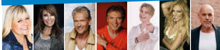
Gaby Baginsky, Ireen Sheer, Olaf Berger, Peter Orloff, Vincent Gross, Loona und Olaf Henning