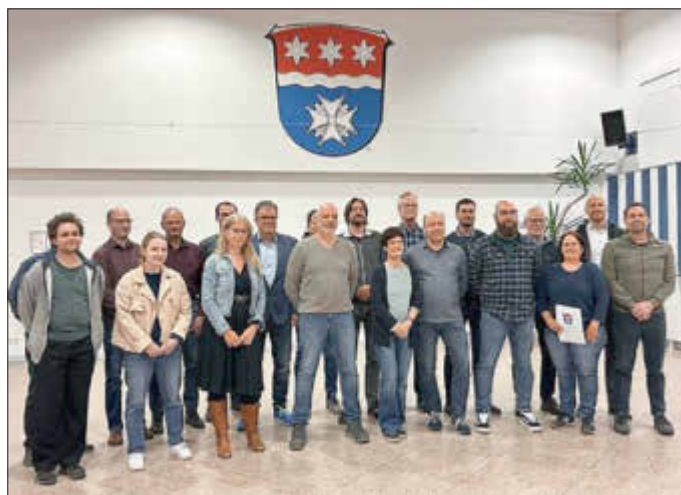
Die neue Gemeindevertretung und der neue Gemeindevorstand am Abend der Konstitution im Bürgerhaus Wohratal.

Die Gemeindevertretung bestätigte im weiteren Verlauf die Gültigkeit der Wahlen der Gemeindevertretung und der Ortsbeiräte und beschloss die Bildung von zwei Ausschüssen. Der Haupt- und Finanzausschuss mit acht Mitgliedern wird sich mit Finanzen, Verkehr und sozialen Themen befassen. Der Bauausschuss mit sechs Mitgliedern übernimmt Aufgaben in den Bereichen Bau, Grundstücke, Landwirtschaft, Umwelt, erneuerbare Energien und Feuerwehr.