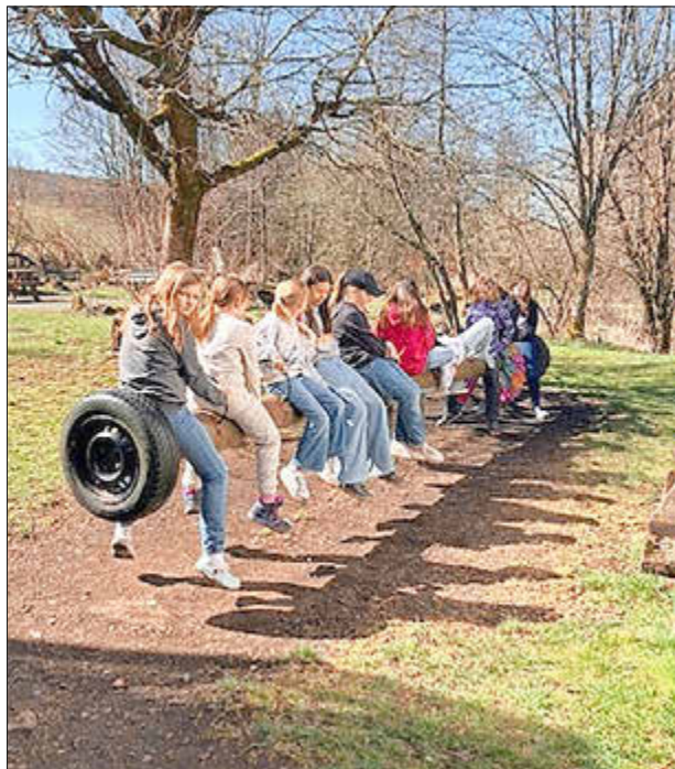
Spiel, Spaß und Abenteuer durften die Kinder auf der diesjährigen Jungscharfzeit im Vogelsberg erleben.

Autohaus Denzel und Pflanzentauschbörse Langendorf