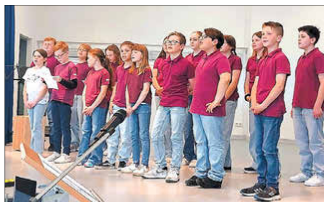
Der MaxiChor aus Erksdorf

Leider waren wieder viel zu wenig nicht singende Zuhörer da, was aber der heiteren Stimmung nicht im Wege stand. Der junge Chor Voll-Bracht aus Bracht unter Leitung von Eric Stöcker machte den Anfang mit einem Lied von Josh, einem österreichischen Sänger. „Expresso und Tschianti“, eine musikalische Liebeserklärung an die Angebetete, bei dem die italienischen Spezialitäten allesamt in Lautsprache ausgesprochen werden. Es folgten Whitney Houston und die Backstreet Boys. Im Übrigen hatten sich alle Chöre für Chormusik aus dem 20. und 21. Jahrhundert entschieden.