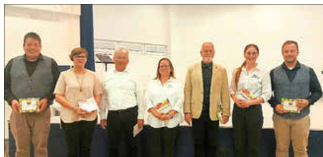
Die Vorsitzenden und Chorleiter der teilnehmenden Vereine.