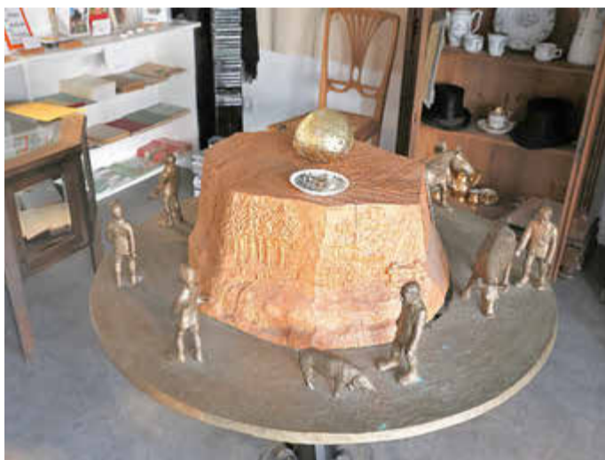
Der Goldklumpen von Hans im Glück

Uhr feiert der Verein übrigens an der Obermühle in Wilhelmshausen, die vom Museum mit betreut wird, und bietet dort einen Blick hinter die Türen. Eine gute Gelegenheit im Verein mitzuwirken. (rs)