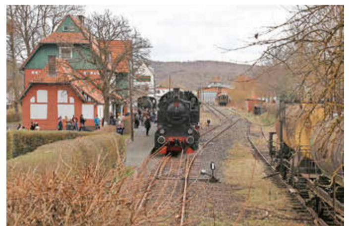
Am Bahnhof in Naumburg