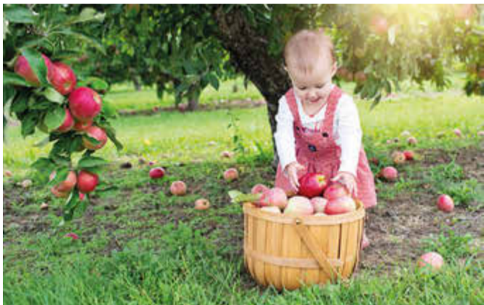
Ein Apfelbaum auf dem Kita-Gelände wird zum lebendigen Lehrbuch.

Eine Chance, Kindern echte Naturerfahrung zu ermöglichen, ihr Bewusstsein für Umwelt und Ernährung zu schärfen – und damit die Grundlagen für eine gesunde, verantwortungsvolle Zukunft zu legen.