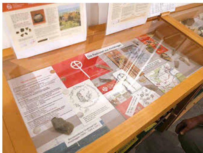
Gewandnadel aus der Bronzezeit