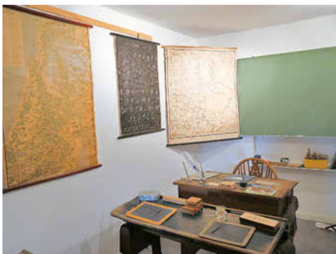
Eine Schulklasse lädt ein