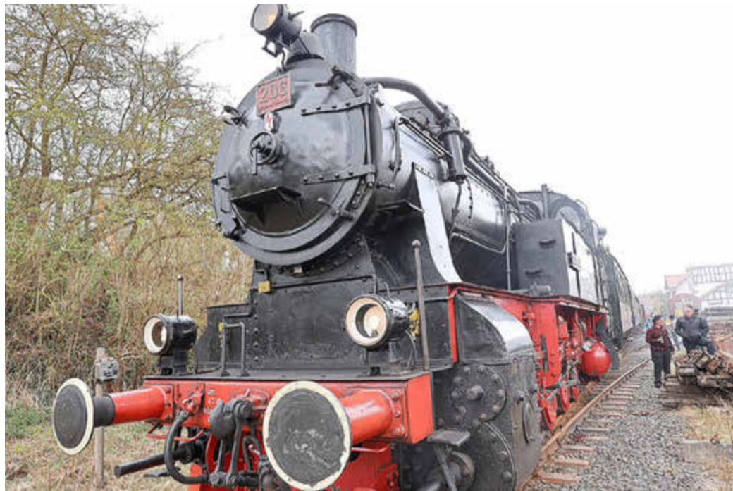
Hessencourrier am Bahnhof in Hoof