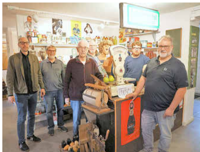
Der aktive Vorstand des Museumsvereins im Dorfladen