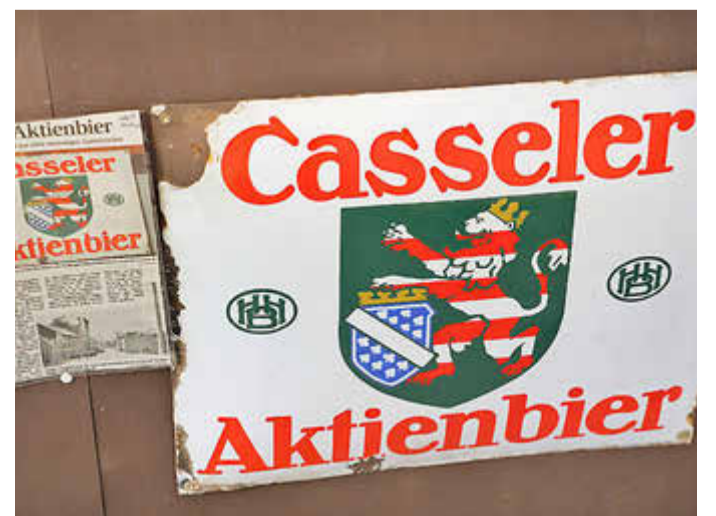
Ein Casseler Aktienbier gefällig?