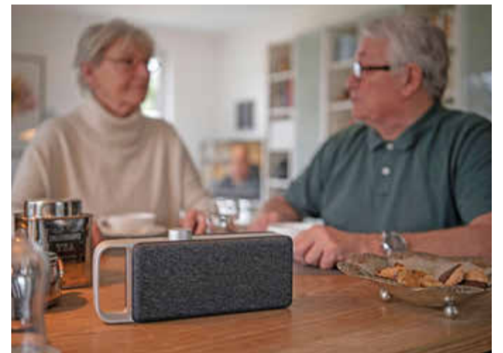
Mit einem Sprachverstärker werden Dialoge wieder besser verständlich.

am Sitzplatz positionieren und bringt so Hörerlebnis zurück ins Wohnzimmer.