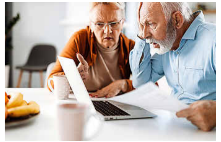
Angehts der steigenden Preise mit hoher Inflationsrate müssen viele Menschen auch ihre Altersvorsorge überdenken.

Und diese Regelung gilt sogar auch für Verträge, die schon vor Jahren gekündigt wurden oder ausgelaufen sind. Ob ein Vertrag betroffen ist, prüft zum Beispiel das Düsseldorfer Verbraucherportal helpcheck gratis und unverbindlich ( www.helpcheck.de/geldzurueck ) auf