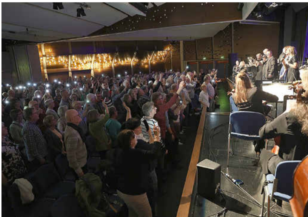
Volles Haus in der Stadthalle Baunatal

Die Musik war nicht nur zu hören, sondern körperlich spürbar. Trommelschläge im Bauch, Bläser wie Fanfaren und Geigen, die scheinbar durch den Raum fliegen – ein Konzert, das alle Sinne anspricht.