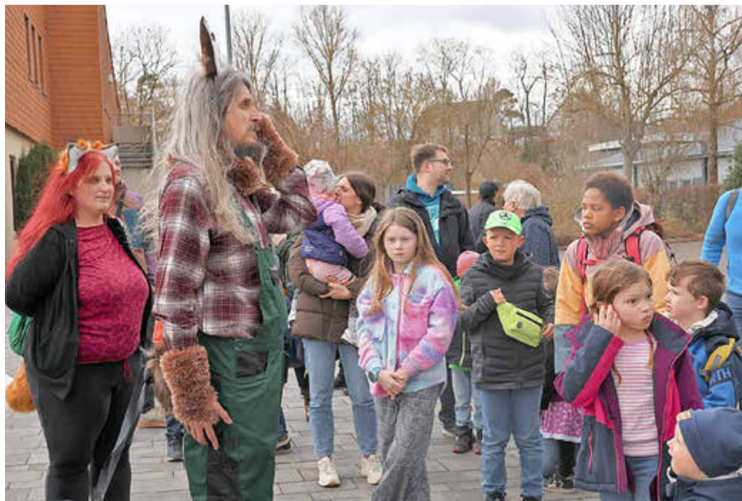
Osterhase in Naumburg

Wer Lust hat mitzufahren, ist herzlich willkommen. Oder buchen Sie doch eine ganze Extra-Fahrt für besondere private oder geschäftliche Anlässe. Informationen, Fahrplan und Tickets (und auch das Spendenkonto) gibt es auf der Internetseite des Hessencourrier. Auf der Titelseite dieser Zeitung verlosen wir Tickets für die Fahrt am 7. Juni. Das Eisenbahnmuseum Naumburg lädt ein zum Bahnhofsfest! Hier darf natürlich der Hessencourrier nicht fehlen. Die Familien erwartet weiterhin im Haus des Gastes Naumburg Herr Müller mit seiner Gitarre. (Rainer Sander)