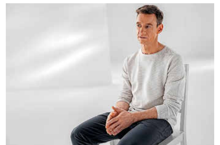
Was wird aus meinen Liebstem? Wie stelle ich mir meinen letzten Weg, meinen Abschied vor? Wer rechtzeitig Vorsorge trifft, kann seine Angehörigen im Fall der Fälle entlasten.