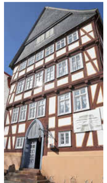
Das Gebäude selbst ist ein Museumsstück