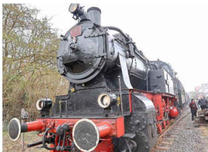
Hessencourrier am Bahnhof in Hoof

Es ist nicht der Orientexpress, es kommt keine Miss Marple ab Paddington um die Ecke und auch Harry Potter startet nicht vom Bahnsteig 9 ¾ mit dem Jacobite Museumszug nach Hogwarts. Start ist im eigenen Bahnhof auf dem früheren Kasernengelände in der Kasseler Marbachhöhe, wo einst Panzer verladen wurden. Ab dort geht es nicht durch exotische Landschaften und an der Strecke liegen nicht die schönsten Fachwerkstädte der Region. Der Zug fährt zurück in eine Zeit, als auf der Strecke vor allem Arbeiter in den Wagen Platz nahmen auf dem Weg zur Fabrik oder Schüler in die Kasseler Gymnasien und Berufsschulen pendelten. Dafür wurde sie gebaut, und diesen natürlichen, nützlichen