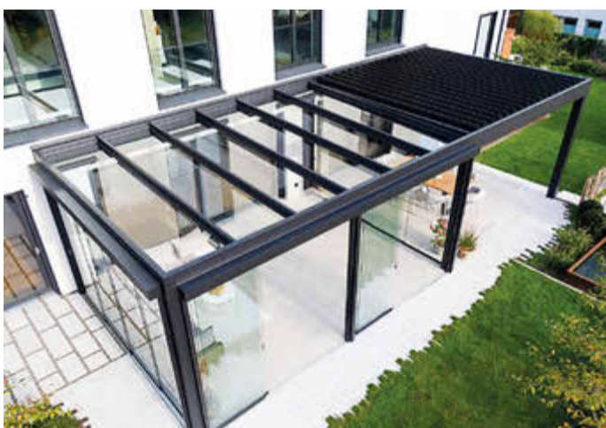
Das Lamellendach lässt sich mit einem Flachdach in nur einem Überdachungssystem kombinieren – und ist damit einzigartig.

chungssystem kombinieren. Durch die modulare Bauweise lassen sich die Dächer ganz einfach miteinander verbinden und fügen sich durch das geradlinige Design harmonisch in die Architektur von Haus und Garten ein – in der Breite sind bei der Flachdach- und Lamellendach-Kombination keine Grenzen gesetzt.