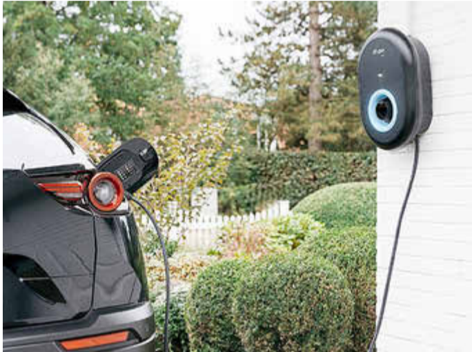
Das Laden des E-Autos daheim ist besonders bequem, flexibel – und in Verbindung mit innovativen Stromtarifen auch kostengünstiger.

den Nachtstunden meist günstigeren Börsenstrompreisen profitieren die Kunden des Flextarifs durch einen Bonus von bis zu 240 Euro pro Jahr – ohne den preislichen Risiken am Spotmarkt ausgesetzt zu sein. Auf Wunsch kann die intelligente Aufladung auch für einzelne Ladevorgänge