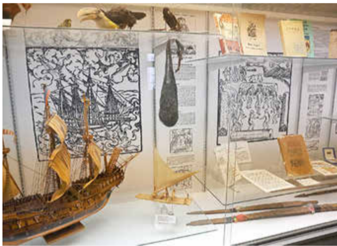
Würdigung von Hans Staden