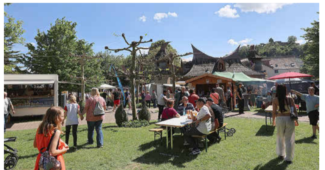
Buntes Treiben rund um die Märchenbühne in Gudensberg

Der Schmeckefuchs findet am Sonntag, 10. Mai 2026, von 11:00 bis 18:00 Uhr im Stadtpark Gudensberg statt. Der Eintritt beträgt 4,00 Euro für Erwachsene sowie 2,00 Euro für Kinder und Jugendliche im Alter von 10 bis 17 Jahren. Kinder unter 10 Jahren haben frei-