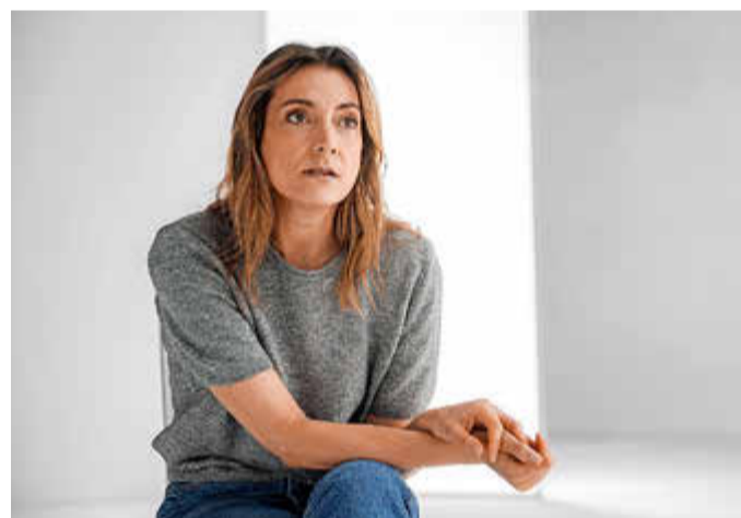
Es sind die stillen Momente im Leben, in denen Menschen der Gedanke an den eigenen Tod beschäftigt. Das Nachdenken darüber kann dazu führen, dass man bewusst Vorsorge trifft – für sich und die Liebstem.