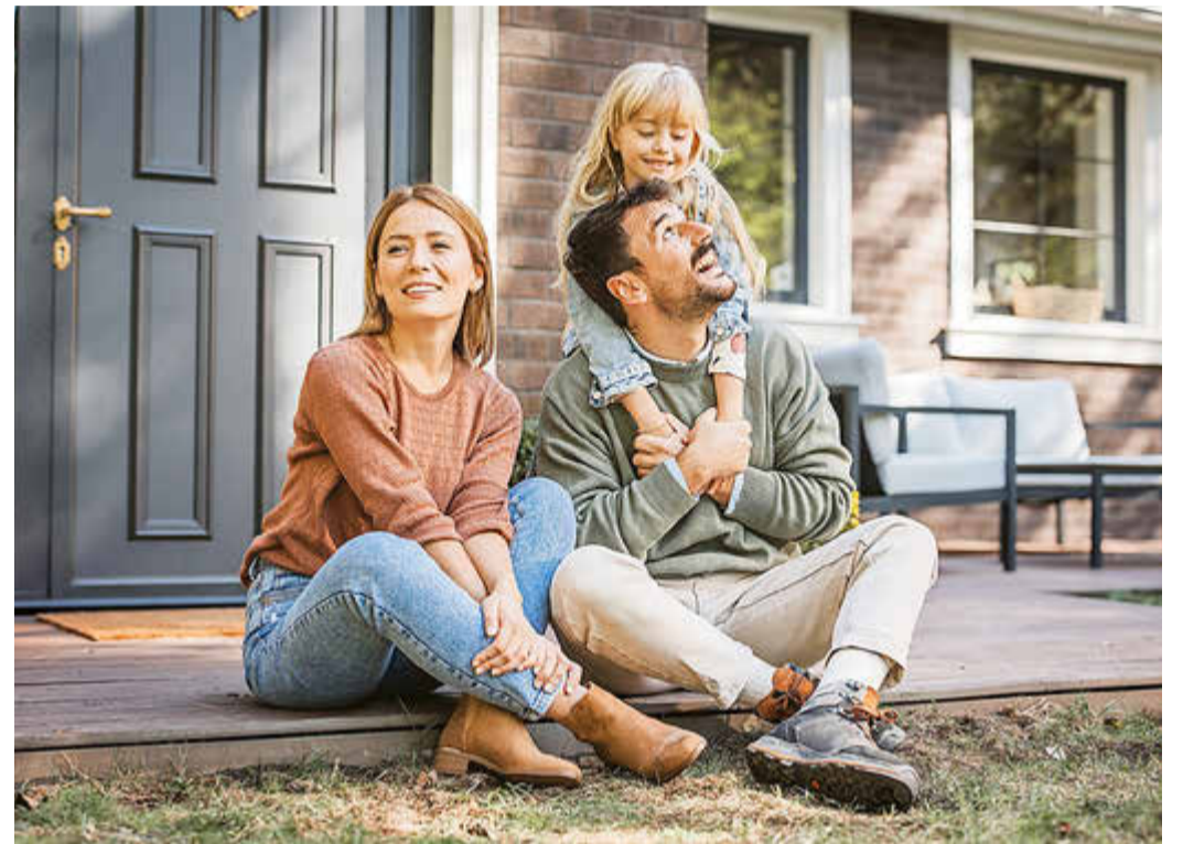
Für junge Familien ist es eine große finanzielle und organisatorische Entlastung, wenn Eltern oder Großeltern mit einer Sterbegeldversicherung abgesichert sind.

satorische Angelegenheiten erledigen müssen. Hinzu kommt die finanzielle Seite: Eine Bestattung kostet laut Stiftung Warentest im Schnitt mindestens 6.000 bis 8.000 Euro. Dazu kommt noch die Trauerfeier. Das belastet die Hinterbliebenen zusätzlich. „Wer seine Liebstem in einer schwierigen Lebenssituation wirkungsvoll entlasten will und über den Tod hinaus selbstbestimmt handeln möchte, sollte seine Gedanken in verantwortungsvolles Handeln überführen“, empfiehlt Dietmar Diegel, Vorsorgeexperte bei Dela Lebensversicherungen. Die Sterbegeldversicherung dieses Anbieters etwa schützt die Hinterbliebenen und sichert die eigene Wunschbestattung, unter www.dela.de gibt es mehr Informationen, zudem findet man auf der Website kostenlose Vorsorgedokumente zum Download.