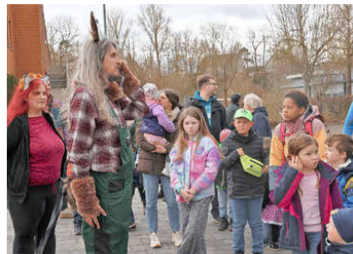
Osterhase in Naumburg