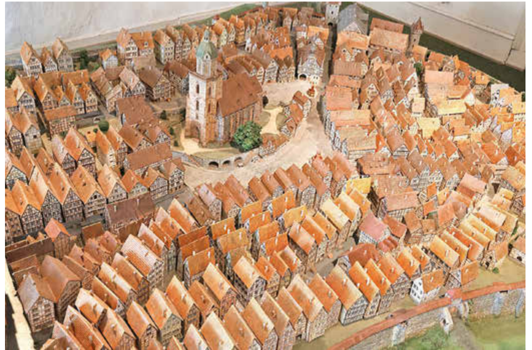
Sehenswerte Stadtmodell von Homberg

Handwerk, Alltag und Gemeinschaft stehen im Mittelpunkt weiterer Stationen. Die Weber-