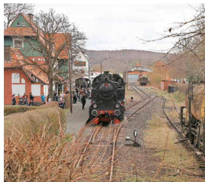
Am Bahnhof in Naumburg