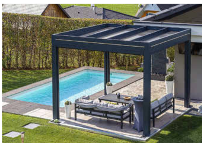
Den Traum vom privaten Wohlfühlparadies wahr werden lassen und den Garten wetterunabhängig genießen – ganz einfach mit Sonne-am-Haus.de.