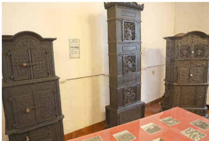
Ofenproduktion aus Holzhausen