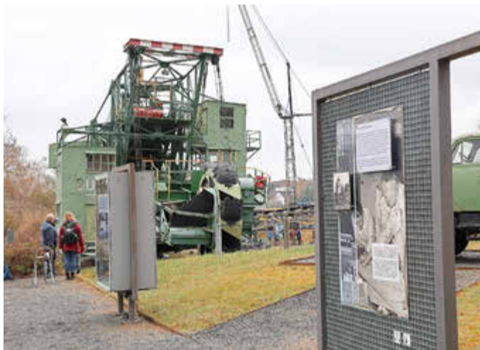
Frühlingserwachen im Themenpark

del durch CO 2 -Emissionen. Und natürlich geht es dabei auch um die Historie der Braunkohle in Borken und regenerative Energien. 42.000