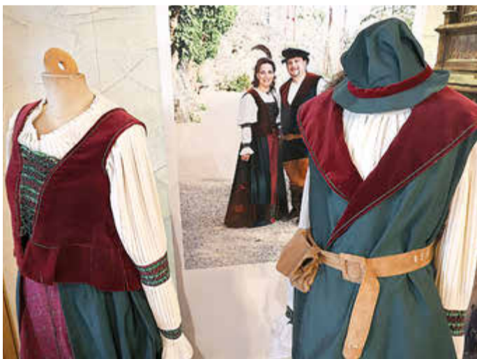
Alte Tracht mit dem Hessentagspaar von 2008

gasse erinnert noch heute an längst ausgestorbene Berufe. Eine kleine Bäckerei erinnert daran, dass hier vor gar nicht langer Zeit noch Brot und Kuchen gebacken wurden. Auch das ist inzwischen tatsächlich Geschichte. Die Ausstellungsstücke zu Zunfthandwerk und Braukunst erinnern daran, wie wichtig Handwerk und Bier für das städtische Leben waren. Alles Einblicke in „Leben und Arbeiten in früherer Zeit“, die ein Gefühl dafür vermitteln, wie stark sich der Alltag im Vergleich zu heute verändert hat. Aber auch vorindustrielle Fertigung, wie die Ofen-Manufaktur in Holzhausen, wird ausführlich dokumentiert.