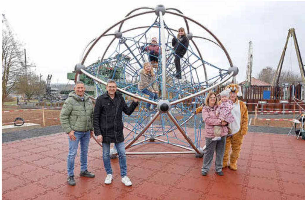
Neue Kletterkugel im Themenpark des Bergbaumuseums

Die Kletter-Weltkugel ist Kernstück des neuen museumspädagogischen Bausteins. Das Leitexponat, eine Strom-Mast-Spitze, wird demnächst im Museum aufgestellt. Ergänzt wird das Projekt Kletterkugel in den nächsten Wochen durch Vitrinen und Infotafeln mit Audioausgabe, auf denen Kinder aus der ganzen Welt erklären, wie sich Klimawandel in ihren Ländern auswirkt. Es dient der Veranschaulichung langfristiger Folgen von Erderwärmung und Klimawandel