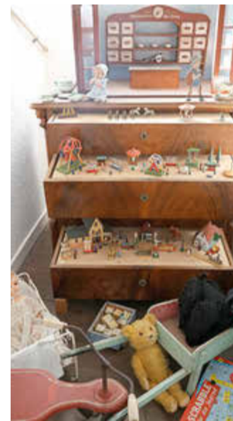
Hier möchte man heute noch spielen