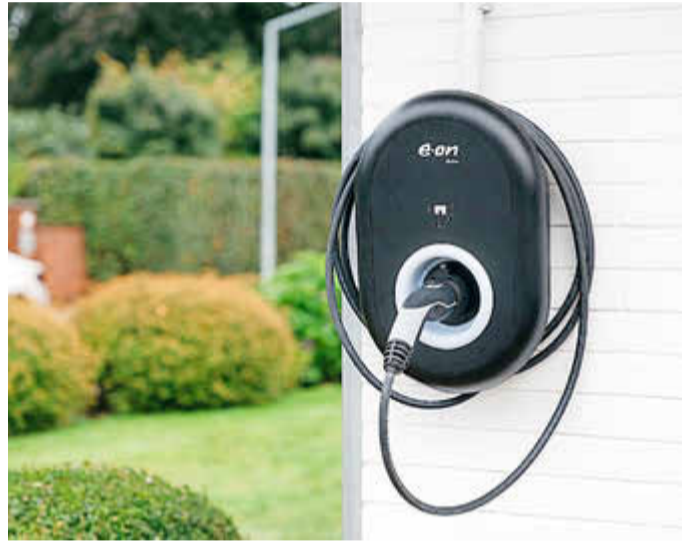
Das intelligente Aufladen des Stromers zu Hause kann bares Geld sparen.