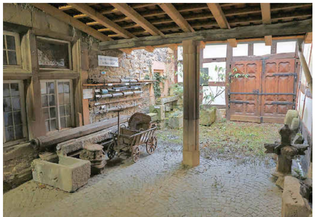
Der Innenhof mit alten Wasserleitungen