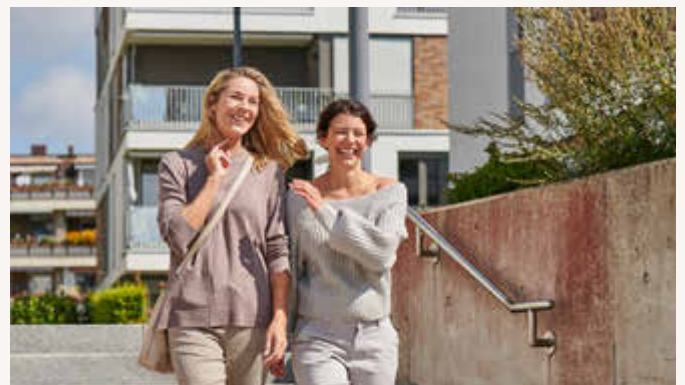
Körperlich fit und agil zu sein, bedeutet Freiheit. Diese Freiheit möchten wir uns natürlich in jeder Lebensphase erhalten.

Diasporal „Pro Muskeln und Knochen“ kann dabei helfen. Die Vitalstoffkombination mit hochdosiertem Magnesium, Vitamin K2 und Vitamin D3 für Muskeln, Knochen und Abwehrkräfte trägt zur Deckung des täglichen Bedarfs bei. Das Produkt ist in der Apotheke als 2-Phasen-Tablette mit Sofort- und Langzeitfreisetzung erhältlich sowie im praktischen Direktstick mit fruchtigem Geschmack. Mehr Infos gibt es unter www.diasporal.com .