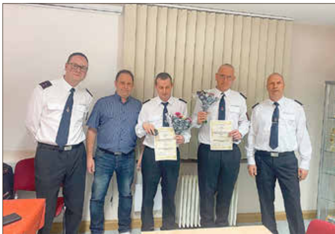
Beförderung zum Löschmeister