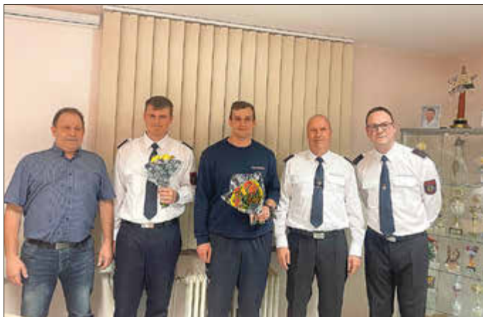
Aufnahme in die Einsatzleitung