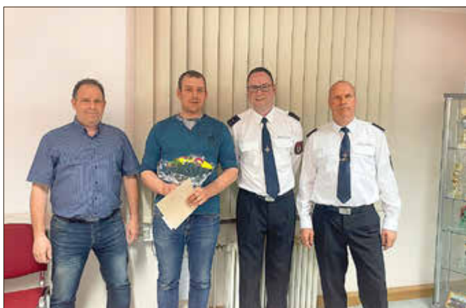
Ehrenurkunde für 22 Jahre Feuerwehr, Verabschiedung wegen Umzug