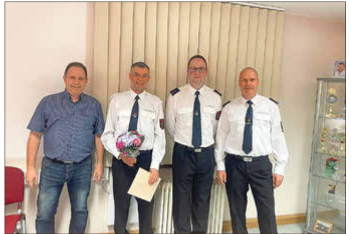
Ehrenurkunde für 25 Jahre Atemschutzgerätewart und Ausbilder AGT