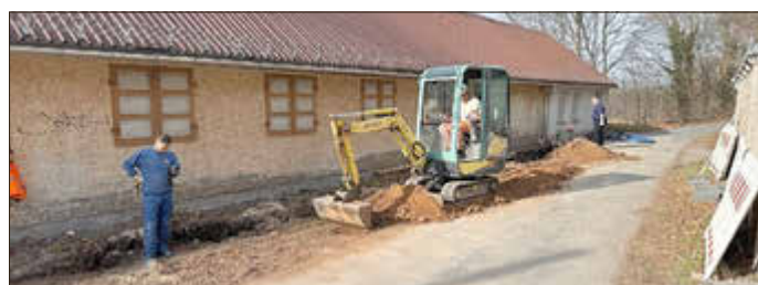
Bei den Arbeiten an der Kegelbahn in Ranis wurde ein rund 40 Meter langer Graben ausgehoben, um eine neue Wasserleitung zu verlegen.

Vor rund drei Wochen wurde an der Kegelbahn in Ranis ein Wasserrohrbruch festgestellt. Um die Wasserversorgung der Anlage langfristig sicherzustellen, mussten kurzfristig umfangreiche Reparatur- und Erneuerungsarbeiten durchgeführt werden.