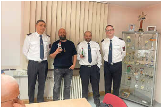
2 Neumitglieder des Feuerwehrvereins