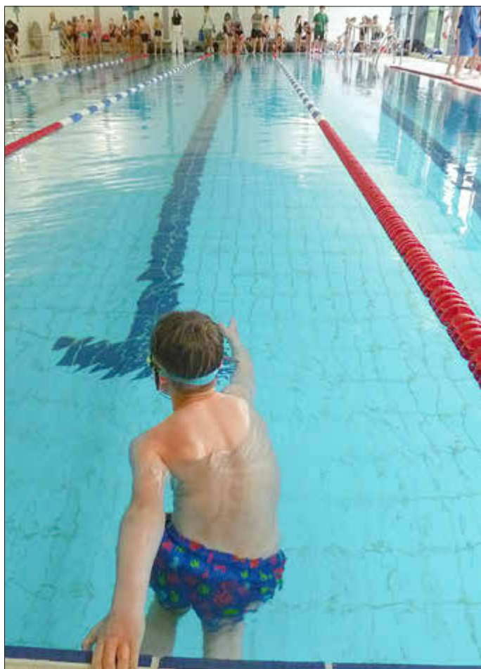
Bericht und Bild: Anke Murkowitz

Wir gratulieren unserer Mannschaft zu ihrem erfolgreichen Wettkampf und freuen uns schon auf die nächste Teilnahme in Küps!