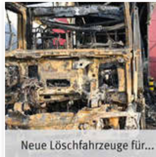
Neue Löschfahrzeuge für...

Die Feuerwehr Treffurt übernimmt als Stützpunktwehr im nördlichen Wartburgkreis wichtige Aufgaben der überörtlichen Gefahrenabwehr. Die neuen HLF 10 werden künftig nicht nur bei Bränden, sondern auch bei Verkehrsunfällen, technischen Hilfeleistungen und Unwettereinsätzen eine zentrale Rolle spielen. Mit der geplanten Indienststellung der Fahrzeuge Ende 2027 beziehungsweise Anfang 2028 wird die Einsatzbereitschaft der Feuerwehr langfristig weiter gestärkt und die Sicherheit der Bürgerinnen und Bürger nachhaltig gesichert.