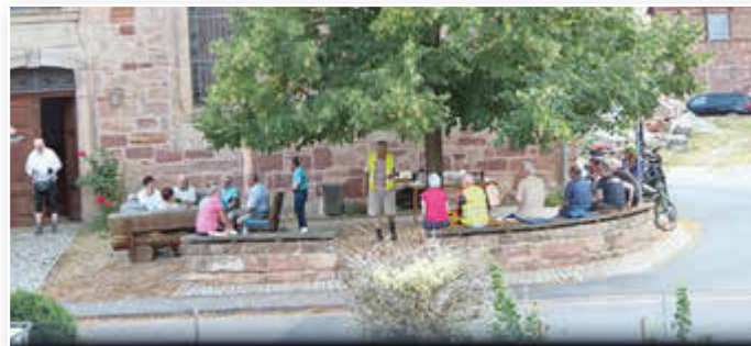
Sommercafé an der Radwegkirche „Der gute Hirte“ Großtöpfer.

Weiterhin liegt Großtöpfer am Jakobsweg, der „Via Scandinavica“ und wird zunehmend von Pilgern von oder zum Franziskanerkloster auf dem nahegelegenen Hülfenberg aufgesucht. So entstand in der Evangelischen Kirchengemeinde Großtöpfer der Wunsch, eine gastgebende Gemeinde zu werden. Die Kirche „Der gute Hirte“ erhielt 2012 das Signet „Radwegkirche“. Wanderer, Pilger und Radfahrer sind nun eingeladen, Halt zu machen. Aus Hessen kommend, ist somit die Begrüßung im ersten Ort in Thüringen zugleich auch eine Einladung zur Besinnung in einer offenen Kirche. Ein „Spirituelle Radtourismus“.