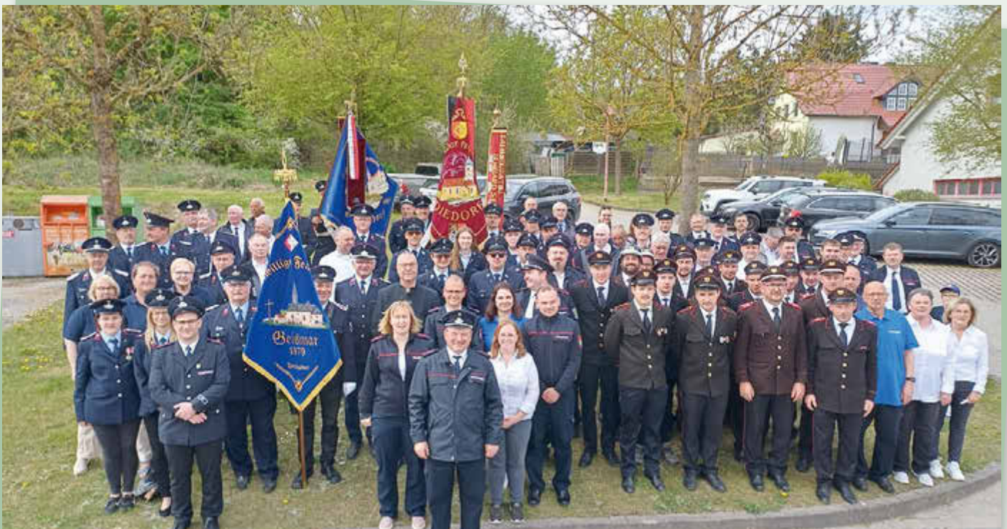
Abordnungen der Feuerwehren Diedorf (Eichsfeld), Diedorf (Schwabens), Latzfons (Südtirol) und Geismar stellen sich nach dem Festgottesdienst zum Erinnerungsfoto.