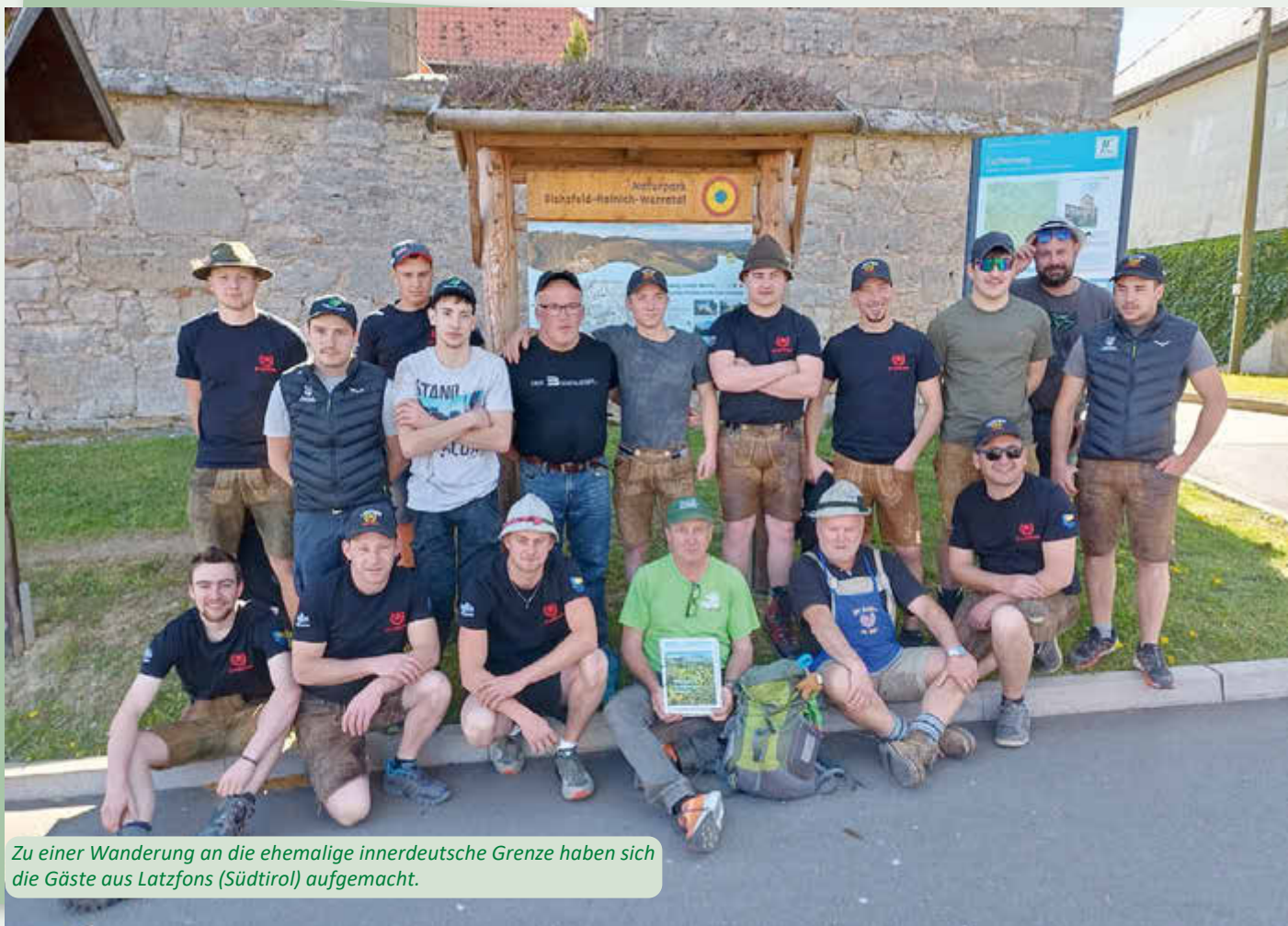
Zu einer Wanderung an die ehemalige innerdeutsche Grenze haben sich die Gäste aus Latzfons (Südtirol) aufgemacht.