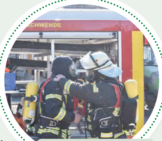
Schierschwendes Feuerwehr belegte beim Kreisausscheid den zweiten Platz in der Bewertung Staffelfahrzeug.