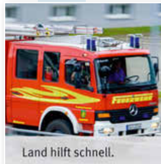
Land hilft schnell.