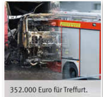
352.000 Euro für Treffurt.