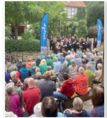
2025 gastierte der mdr-Rundfunkchor in Großtöpfer mit einem Dankeschön-Konzert für die ehrenamtliche Arbeit der „Rotkäppchen“-Frauen.

Dazu gibt es frische Waffeln, Kaffee und Getränke für die vorbeikommenden Radlerinnen und Radler, Gäste sowie Einheimische. So auch am 30.08.2026, vor dem Konzert (siehe unten).