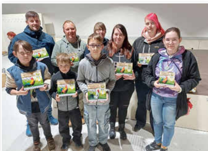
Die erfolgreichen Geflügelzüchter und Sieger beim Wettkrähen in Heyerode.