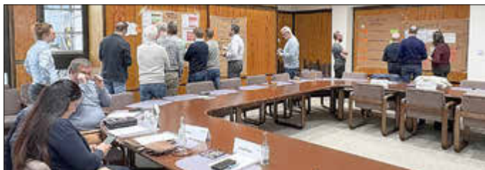
Die Mitglieder des LAG Westrich-Glantal e. V. ziehen in einem Evaluierungsworkshop eine Zwischenbilanz der aktuellen Förderperiode.