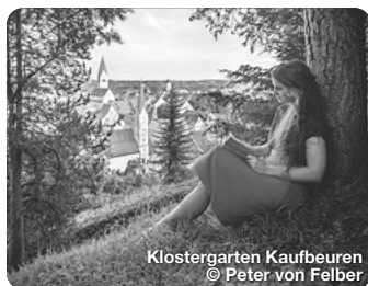
Klostergarten Kaufbeuren

Wie ein Schatzkästchen liegt er im Herzen des Allgäus, im bayerischen Süden Deutschlands. Er ist einer von neun Erlebnisräumen der Region und erstreckt sich über den gesamten Landkreis Ostallgäu, von Füssen über Pfronten, Nesselwang, Halblech, Marktoberdorf bis nach Kaufbeuren und Buchloe. Die königliche Gipfelkulisse aus Ammergauer, Allgäuer und Tannheimer Bergen wachen wie steinerne Riesen über mystische Seen, rauschende Flüsse, sanft gewellte Hügelmeere und sattgrüne Wiesen, zwischen die Dörfer und historischen Städte eingebettet sind. Die archaische Poesie der Landschaft wirkt wie ein großer, weiter Park, der sich vor den vielen Schlössern und Burgen der Region ausbreitet, vor allem zu Füßen des Märchenschlosses Neuschwanstein. TreffpunktDeutschland.de/ostallgaeu