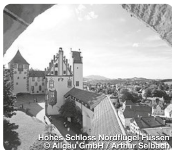
Hohes Schloss Nordflügel Füssen