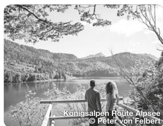
Königsalpen Route Alpsee