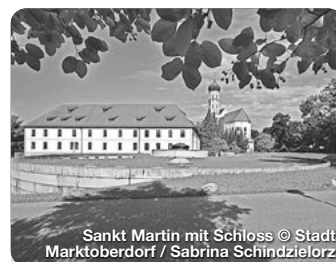
Sankt Martin mit Schloss Marktoberdorf / Sabrina Schindzielorz

Eine Stadt mit Mittelaltercharme, vielen Sehenswürdigkeiten und einem bunten Veranstaltungsmix. Eindrucksvoll ist der Spaziergang auf der um 1200 erbauten Stadtmauer zwischen der spätgotischen St. Blasius-Kirche und dem Fünfknopfturm. TreffpunktDeutschland.de/kaufbeuren