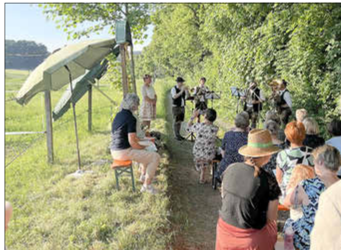
Das Bläserquartett „Ruck Zuck“ begleitete die Maiandacht musikalisch

Mit dem Schlussegen endete die Maiandacht, und viele Besucherinnen und Besucher nutzten anschließend noch die Gelegenheit zu Begegnung und Gespräch. -td