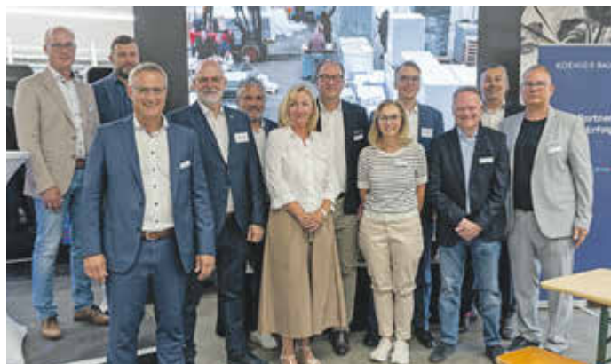
▲ LINUS WITTICH und Koenig & Bauer arbeiten gut zusammen.