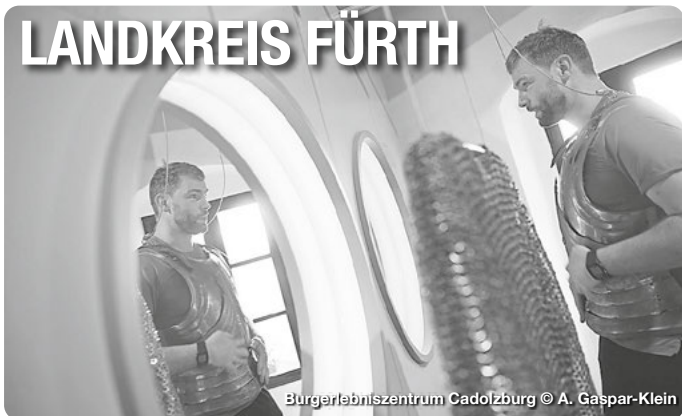
Bürgerlebenszentrum Cadolzburg

Alle Termine und Angaben unter Vorbehalt!