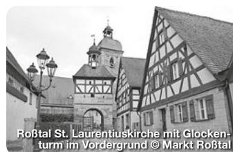
Roßtal St. Laurentiuskirche mit Glockenturm im Vordergrund

Wer an Stein denkt, dem fällt wohl zuerst Faber-Castell ein oder die B14 oder beides. Dabei hat die Stadt, die zwar am südwestlichen Rand Nürnbergs am linken Ufer der Rednitz liegt, aber zum Landkreis Fürth gehört, viel, viel mehr zu bieten. TreffpunktDeutschland.de/rosstal