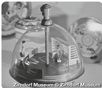
Zirndorf Museum