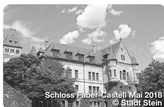
Schloss Faber-Castell Mai 2018

Ehem. Augustiner Chorherrenstift Das Kloster wurde 1409 von den Burggrafen von Nürnberg Johann III. und Friedrich VI. gestiftet. Zerstörung im Jahre 1460. Wiederaufbau bis 1468. Prinzregentenplatz 2, Langenzenn