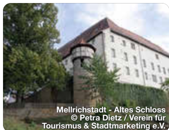
Mellrichstadt - Altes Schloss

Der Landkreis Rhön-Grabfeld liegt im Herzen Deutschlands und ist bekannt für seine atemberaubende Natur. Die Region ist geprägt von Bergen, Tälern, Flüssen, Seen und Wäldern. Mehr als 50 % des UNESCO-Biosphärenreservats Rhön befinden sich im Landkreis Rhön-Grabfeld. Hier wird die Natur mit ihren vielen, teilweise selten gewordenen Tieren und Pflanzen geschützt und bewahrt. Gleichzeitig bietet die einmalige Natur- und Kulturlandschaft viele Bildungs- und Erlebnisangebote für Besucherinnen und Besucher. Ein Beispiel für Schutz, Erlebnis und Bildung zugleich ist das Schwarze Moor auf der Langend Rhön, welches zu den bedeutendsten Hochmooren Europas zählt. Mit solchen Besonderheiten und derzeit 243 Wandertouren ist die Region ein Paradies für Wanderbegeisterte. TreffpunktDeutschland.de/rhoen-grabfeld