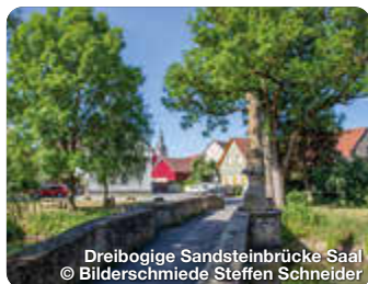
Dreibogige Sandsteinbrücke Saal