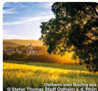
Ostheim vom Büchig aus

Durch Nordheim fließt der beschauliche Bach „Streu“ und sorgt damit für eines der Highlights des Dorfes. Denn über die Streu führt eine alte steinerne Brücke, die heute noch sehr gut erhalten ist. TreffpunktDeutschland.de/nordheim-rhoen