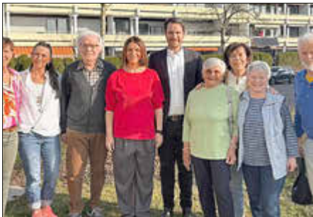
AWO Ortsverein Dittelbrunn Vorstand

Nach der Zustimmung zur Satzung folgen nun die formalen Schritte wie die Eintragung ins Vereinsregister und die Beantragung der Steuernummer. Der neue AWO-Ortsverein Dittelbrunn möchte künftig generationenübergreifende Projekte initiieren und das ehrenamtliche Engagement in der Gemeinde stärken.