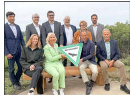
Gruppenfoto der feierlichen Ausweisung des Naturschutzgebietes Brönnhof

Die naturschutzfachliche Bedeutung des Gebiets ist herausragend: Insgesamt sind dort 63 Arten der Roten Liste der Kategorien 1 und 2 bekannt, darunter seltene Vogelarten, Nachtfalter, xylobionte Käfer, Amphibien, Fledermäuse, Wildbienen und gefährdete Pflanzenarten. Nachgewiesen wurden dort zudem 18 Arten der FFH-Anhänge II und IV sowie sieben Brutvogelarten des Anhangs I der Vogelschutzrichtlinie.