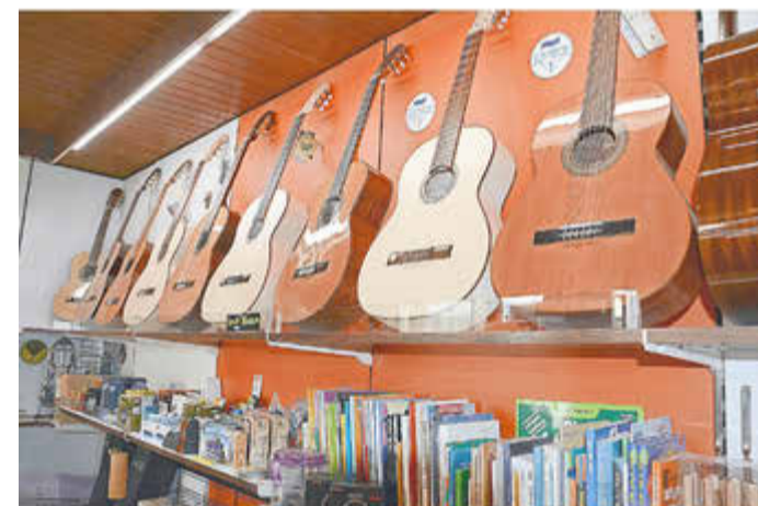
Bei Musik Bartl geht dem Musiker das Herz auf: Von der Konzert- bis zur E-Gitarre, große Auswahl und kompetente Beratung. Aber hier gibt es natürlich nicht nur Saiteninstrumente.

flohmarkt. Beim Fest verkauft das Team Kaffee und Kuchen. Kuchenpenden zur Unterstützung des Verkaufs nimmt die Umweltstation dankend an. Kontakt: Tel. 09545/950399 Das Team der Umweltstation Lias-Grube freut sich auf zahlreiche Besucherinnen und Besucher und einen gelungenen Start in die neue Saison. Anmeldung und nähere Informationen unter www.umweltstation-liasgrube.de oder 09545/950399.