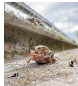
Erdkröten-Paar auf Wanderung.

(ERH7), Wehrwiesenweg - Unterschöllnbach (ERH 33) sowie auf Ortsstraßen im Bereich Hemhofen/Zeckern und der Ortsverbindungsstraße Großenseebach - Untermembach sowie auf den Staatsstraßen St2254 zwischen Zentbechhofen - Herrnsdorf und St2263 zwischen Weisendorf - Hammerbach unterwegs. Während der Arbeitseinsätze der Ehrenamtlichen weisen Schilder die Kraftfahrer auf Gefahrenstellen hin. Das Landratsamt Erlangen-Höchstadt bittet um erhöhte Vorsicht und Aufmerksamkeit.