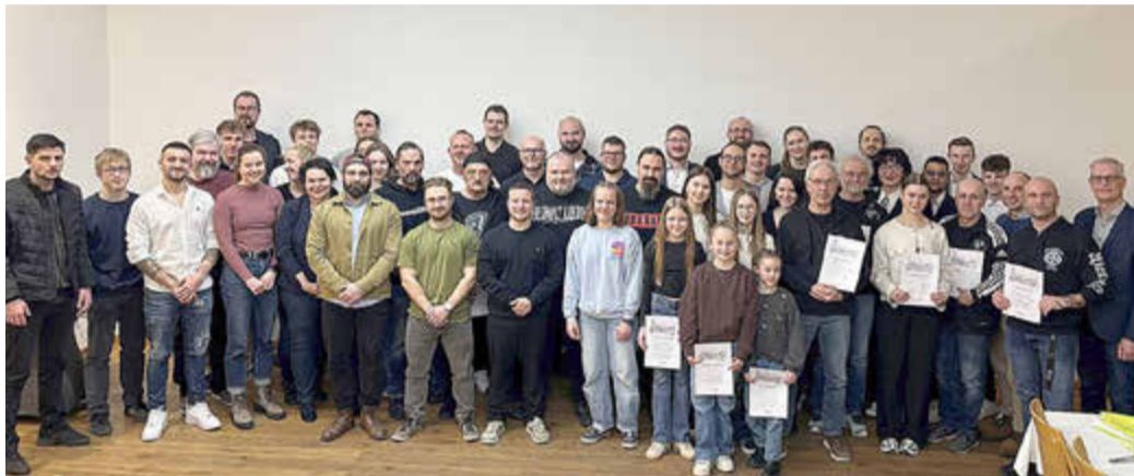
Gruppenbild der 48 anwesenden Sportler*innen mit Oberbürgermeister Dr. Uwe Kirschstein (re.).

(Stadt Forchheim). Zur Sportlerlehre 2026 hatte die Stadt Forchheim am 24.02.2026, insgesamt 55 Sportler*innen zum Ehrungsabend in den Pilatushof geladen, um sie für ihre herausragenden Leistungen zu ehren. Geehrt wurden diejenigen Sporttreibenden aus den Reihen der Vereine, die sich in den Jahren 2023, 2024 und 2025 durch ganz besondere Erfolge auszeichnen konnten: Sie präsentierten erste, zweite und dritte Plätze bei Welt-, Europa-, Deutschen und Bayerischen bzw. Süddeutschen Meisterschaften, darüber hinaus bei internationalen Wettkämpfen.