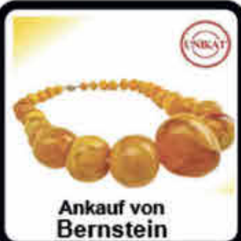
Ankauf von Bernstein

Erbschaften? Wir kaufen Ihre geerbten Schätze auf.