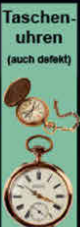
Taschenuhren (auch defekt)

ACHTUNG! Letzter Aufruf für Pelze vor Saisonschluss. Die Nachfrage ist groß, wir zahlen bis zu 8.500 €