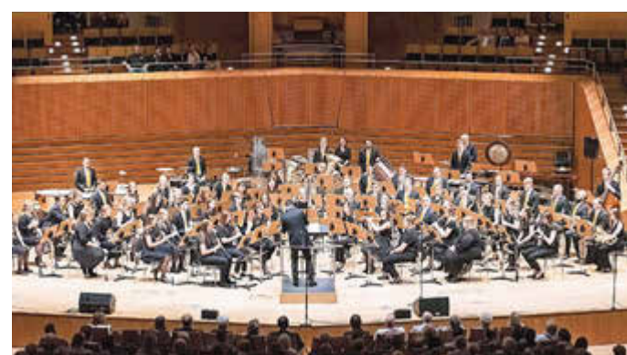
Die Bläserphilharmonie Forchheim beim Frühlingskonzert 2025.

Ende des Konzertes wieder zurück. Fahrkarten gibt es ausschließlich bei den beiden genannten VR-Bank-Filialen solange der Vorrat von 100 Stück reicht.