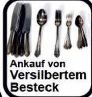
Ankauf von Versilbertem Besteck