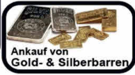
Ankauf von Gold- & Silberbarren