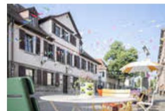
Frühjahrshopping in der Erlanger Innenstadt.

ein - von der Nürnberger Straße über den Hugenottenplatz bis zum Bohlenplatz. Viele Geschäfte beteiligen sich mit geöffneten Türen sowie eigenen Aktionen und Angeboten. Weitere Informationen zum Programm werden in den kommenden Wochen ergänzt. Mehr Infos zum Veranstaltungstag und Programm unter www.visit-erlangen.de/verkaufsoffenersonntag .