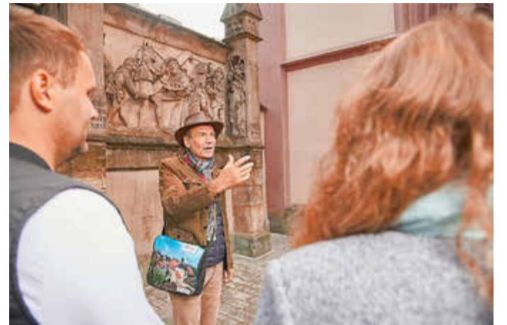
Der Bamberger Kreuzweg.

Lohnenswerte Ziele für Entdecker- und Wandertouren sind um diese Jahreszeit auch die festlich geschmückten Osterbrunnen. Die Brunnen werden mit bunt bemalten Eiern dekoriert und kunstvoll verziert, sodass echte Kunstwerke mit zum Teil vielen tausend Eiern entstehen. In Bamberg, aber auch im östlichen Bamberger Land bis hin zur Fränkischen Schweiz können Osterbrunnen bestaunt werden. Auch der Steigerwald im Westen, die Haßberge im Nordwesten und die Region Obermain-Jura im Nordosten bieten zahlreiche kleinere, liebevoll herausgeputzte Brunnen. An Ostern starten in der Region zudem zahlreiche Stadtführungen und Erlebnisangebote. Informationen zu Reiseangeboten, Stadtrundgängen und Erlebnisreisen bietet die Tourist Information des BAMBERG Tourismus & Kongress Service unter: www.bamberg.info/jahreszeiten/fruehling .