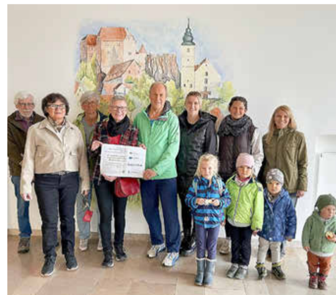
Förderbescheidübergabe Naturerlebnispfad Hiltlpoltstein.