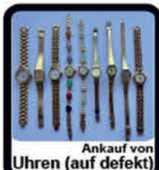
Ankauf von Uhren (auf defekt)

ACHTUNG! Letzter Aufruf für Pelze vor Saisonschluss. Die Nachfrage ist groß, wir zahlen bis zu 8.500 €