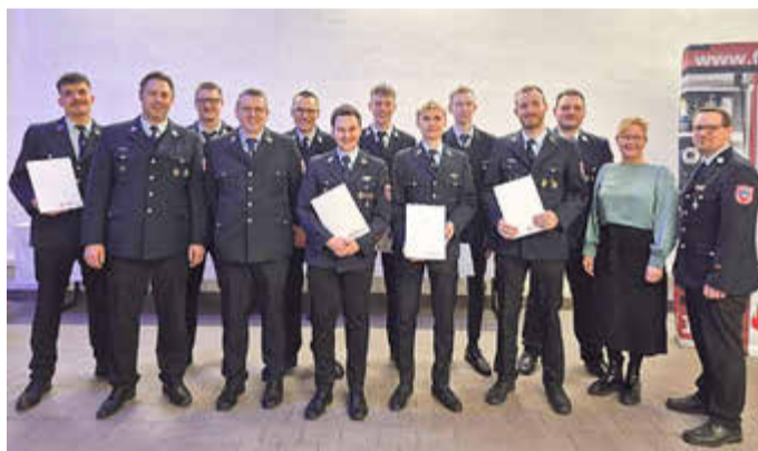
Viele Ehrungen - unter anderem für 25 Dienstjahre - und Beförderungen gab es bei der Dienstversammlung.