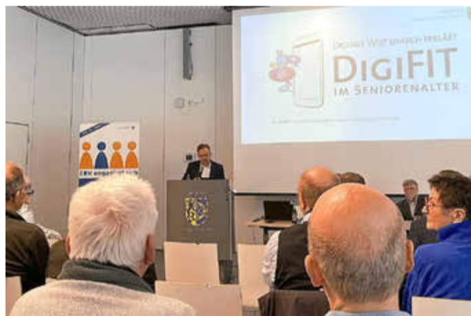
Landrat Alexander Tritthart beim fachlichen und persönlichen Austausch mit Beteiligten des DigiFIT-Projektes. Es bietet seit zwei Jahren eine regelmäßige Anlaufstelle für Seniorinnen und Senioren in Online-Anliegen.

Wer sich als ehrenamtliche DigiFIT Beraterin oder -Berater ausbilden lassen möchte, kann sich gerne an das Ehrenamtsbüro wenden, telefonisch unter 09131/803 1332, per E-Mail an ehrenamtsbuero@erlangen-hoechststadt.de sowie online unter www.erlangen-hoechststadt.de/leben-in-erh/angebote-fuer-senioren/digitale-welt .