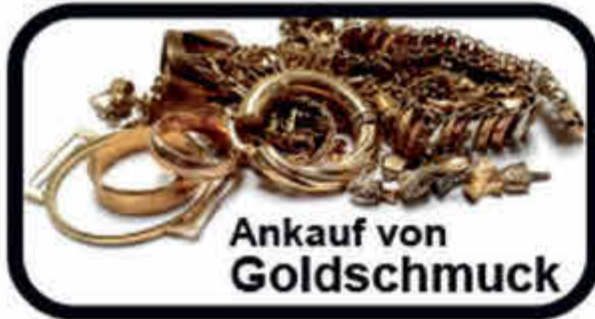
Ankauf von Goldschmuck