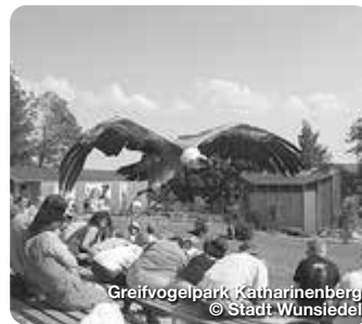
Greifvogelpark Katharinenberg