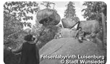
Felsenlabyrinth Luisenburg