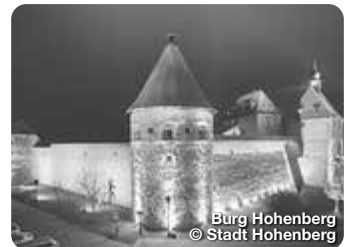
Burg Hohenberg