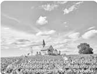
Konradskapelle bei Höchstädt im Fichtelgebirge

Der Landkreis Wunsiedel i. Fichtelgebirge liegt inmitten des Naturparks Fichtelgebirge und bietet mit seiner vielfältigen Landschaft zu jeder Jahreszeit eine immense Fülle an Erlebnissen – für Aktivurlauber, Genießer sowie Familien, aber auch für die nächsten Touren im Wohnmobil oder den anstehenden Wellnessstrip. Dem Aktivurlaub im Fichtelgebirge kommt eine besondere Bedeutung zu: Ob Wandern, Radfahren oder Wintersport, das Fichtelgebirge lässt sich am besten bei Ausflügen in der freien Natur erleben. Thermen, Bewegung in der Natur, Kneipp-Therapien und Tretbecken versprechen Erholung und Entspannung in unberührter Natur im Naturpark Fichtelgebirge. TreffpunktDeutschland.de/wunsiedel-region