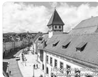
Historisches Rathaus