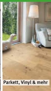
Parkett, Vinyl & mehr