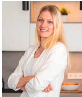
CAROLIN KARGL OBJEKT BETREUUNG & VERWALTUNG