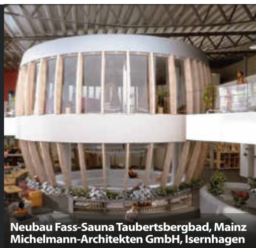
Neubau Fass-Sauna Taubertsbergbad, Mainz Michelmann-Architekten GmbH, Isernhagen