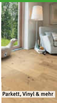
Parkett, Vinyl & mehr