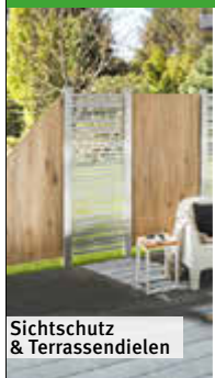
Sichtschutz & Terrassendielen