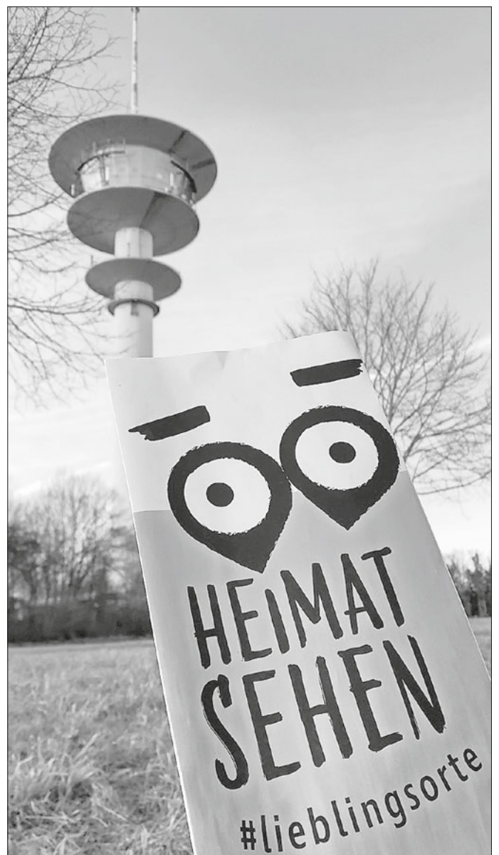
Der Arberger Fernsehturm war einer der Lieblingsorte in der ersten Auflage von „Heimat sehen“. Das Regionalmanagement am Landratsamt Ansbach setzt die erfolgreiche Kampagne nun fort.

Das Regionalmanagement des Landkreises Ansbach setzt seine erfolgreiche Kampagne „Heimat sehen“ fort: Mit „Heimat sehen 2.0“ sind Bürgerinnen und Bürger sowie Kommunen und Vereine erneut aufgerufen, ihre persönlichen Lieblingsorte im Landkreis einzureichen. Bereits die erste Ausgabe der Aktion war ein voller Erfolg. Zahlreiche Einsendungen aus der Bevölkerung machten deutlich, wie reich der Landkreis an besonderen Plätzen ist – von beeindruckenden Landschaften über kulturelle Highlights bis hin zu ganz persönlichen Rückzugsorten. Eine Auswahl dieser Beiträge wurde in der Broschüre „Heimat sehen im Landkreis Ansbach #Lieblingsorte“ gebündelt, die auch online abrufbar ist und die Vielfalt der Region eindrucksvoll widerspiegelt. Alle Interessierten sind eingeladen, ihren persönlichen Lieblingsort bis zum 31. Mai 2026 einzureichen. Begleitet wird die Kampagne auch über die Social-Media-Kanäle des Landkreises, auf denen regelmäßig neue Orte, Geschichten und Eindrücke vorgestellt werden. Weitere Informationen, die Broschüre sowie den Teilnahme-Steckbrief finden Interessierte online auf der Website des Landkreises Ansbach www.landkreis-ansbach.de unter dem Suchbegriff „Heimat sehen“.