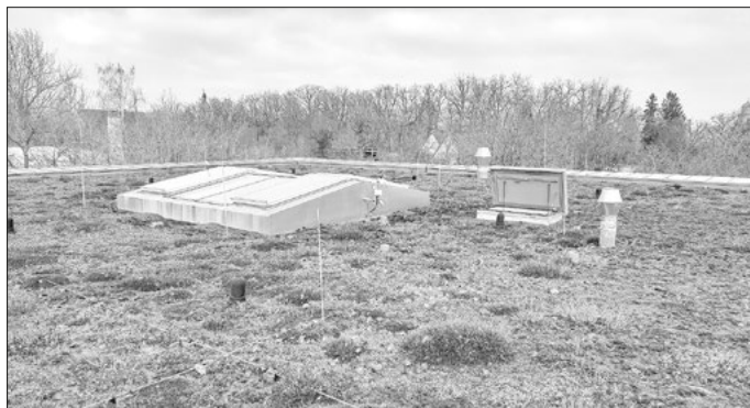
Eine Dachbegrünung gibt es beispielsweise auf dem Erweiterungsbau des Gymnasiums Dinkelsbühl. Ab sofort kann man online prüfen, ob sich das eigene Gebäude für eine Dachbegrünung eignet.

Das Gründachportal ist ein Projekt des Regionalmanagements des Landkreises Ansbach in Kooperation mit dem Klimaschutzmanagement des Landkreises Ansbach. Mit dem neuen Portal wird ein weiterer wichtiger Impuls für eine klimaresiliente und zukunftsfähige Entwicklung der Region gesetzt.