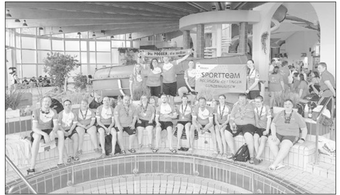
Das Bild zeigt die erfolgreiche Mann- und Frauschaft

Die Vorbereitungen laufen bei Diakoneo daher auf Hochtouren. Neben wöchentlichen Trainings in der Schwimmhalle findet ein Athletik-Training statt, sodass alle in Top-Form zu den deutschen Meisterschaften anreisen können.