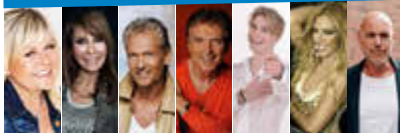
Gaby Baginsky, Ireen Sheer, Olaf Berger, Peter Orloff, Vincent Gross, Loona und Olaf Henning