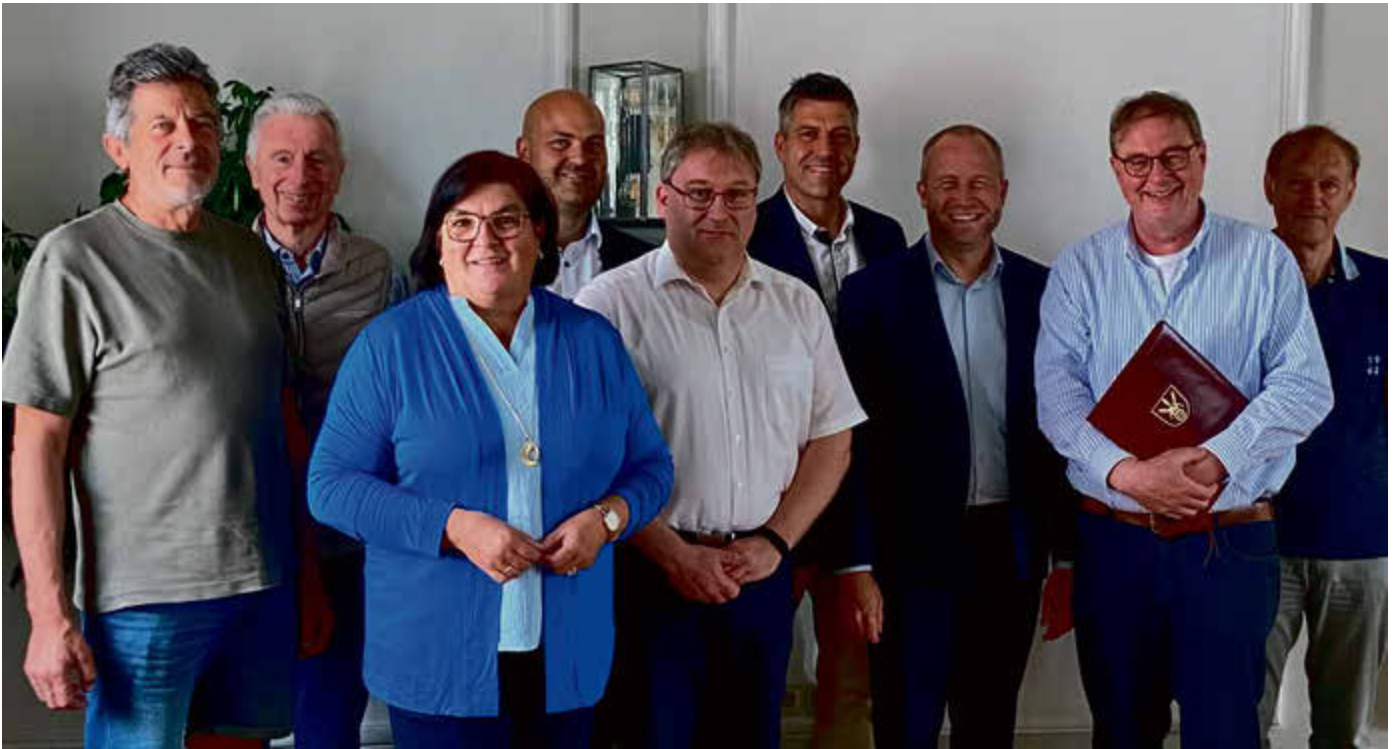
Die Teilnehmer der Sitzung in Dinkelscherben.