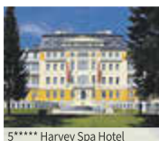
5**** Harvey Spa Hotel

Ausführliche Beschreibungen und eine Auswahl von über 30 Hotels (u. a. Olympia, Centralni Lazne, Nove Lazne etc.) finden Sie im umfangreichen Erholungs-Katalog unseres Leserreisen-Partners Frankenland Reisen, den Sie selbstverständlich kostenlos anfordern können.