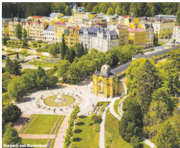
Kurpark von Marienbad