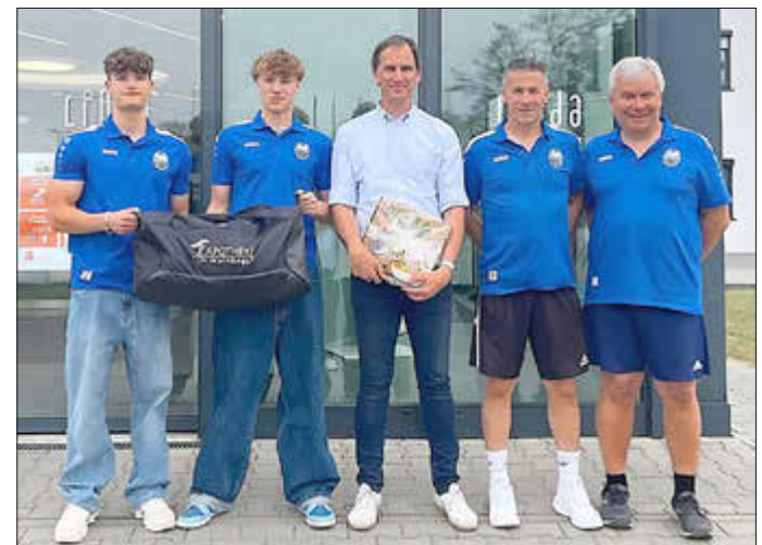
Sponsoring Sporttaschen für die A-Jugend der SG Sennfeld