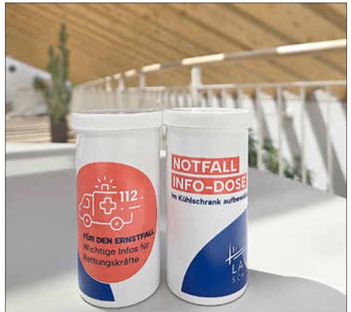
Notfalldosen ab sofort unter anderem im Landratsamt Schweinfurt erhältlich.