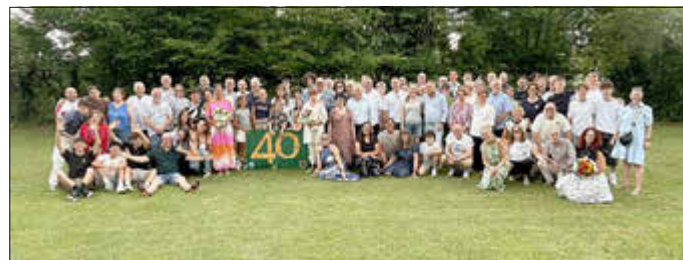
Teilnehmer Jubiläumsfeier