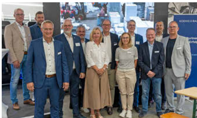
▲ LINUS WITTICH und Koenig & Bauer arbeiten gut zusammen.