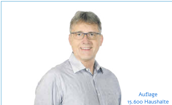
Auflage 15.600 Haushalte

Buchen Sie Ihre gewerbliche Anzeige im Amtsblatt Neu-Ulm schon ab 22,50 € Netto inkl. Farbe.