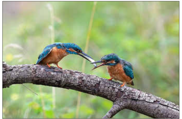
Auch Eisvögel brüten am Plessenteich

Am Mittwoch, den 06.05.2026, führt der Gerlenhofener Arbeitskreis Umweltschutz (GAU) interessierte Besucher zum Plessenteich. Kommen auch Sie mit, um die faszinierende Vogelwelt des Plessenteichs zu erkunden. Sie erfahren dabei, wie der Plessenteich zum Vogelparadies wurde und was alles nötig ist, um die Vogelvielfalt dort zu erhalten.