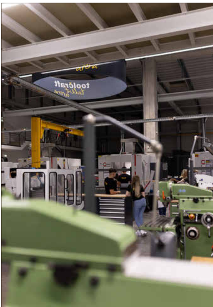
Die Lehrwerkstatt bei Toolcraft am Standort Georgensmünd