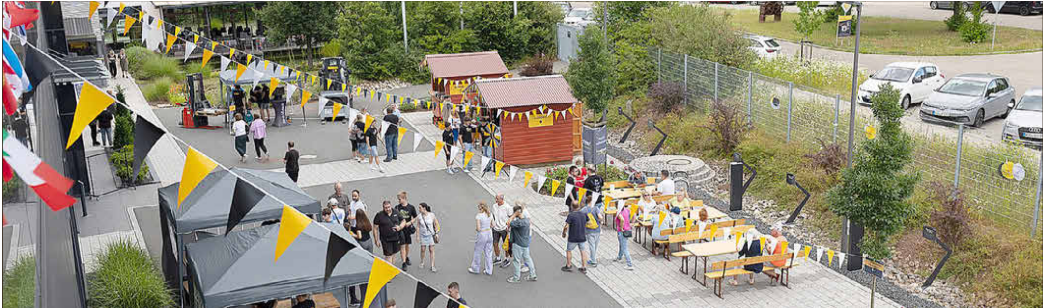
Die Talent Night auf dem Firmengelände von Toolcraft in Georgensmünd

Informationsabend in Georgensmünd bietet Einblicke in verschiedene Ausbildungsberufe