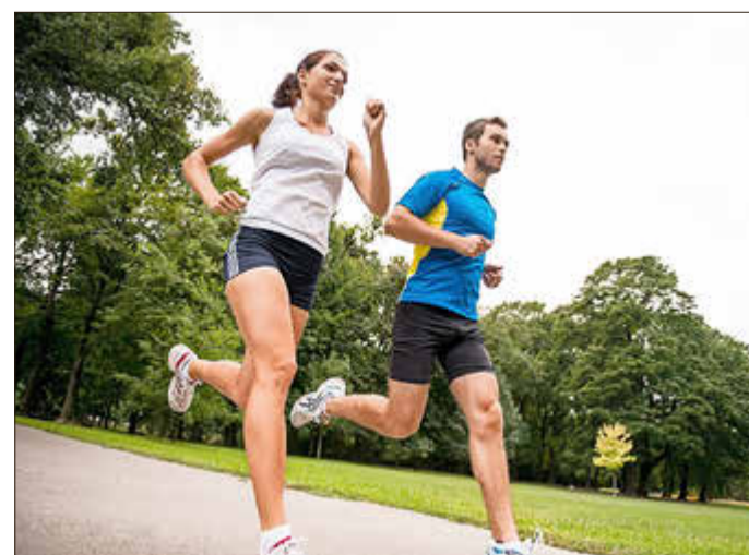
Bewegung ist gesund - doch wer Sport treibt, kann auch einen schmerzhaften Muskelkater erleiden.

Zum Thema „Das hilft wirklich gegen Muskelkater – 4 Tipps!“ bietet „AOK – Der Gesundheitskanal“ ein Youtube-Video mit Doc Felix an.