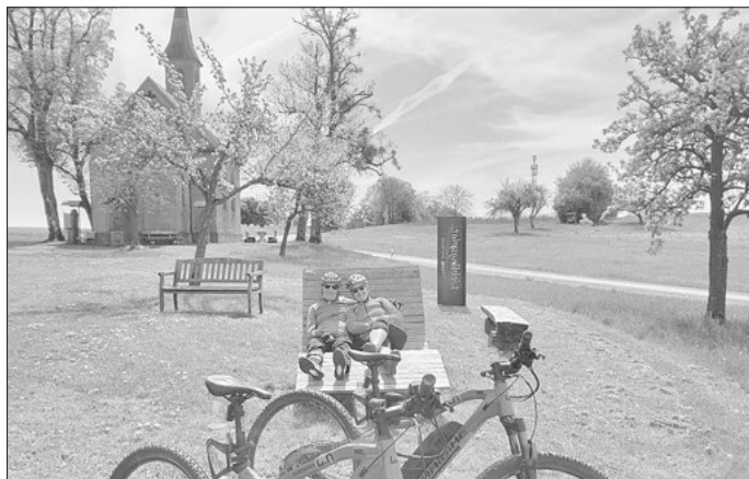
Entspannte Möglichkeiten zur Pause bot die Lieblingsplatz-Radtour 2026

Die Lieblingsplatz-Radtour hat einmal mehr gezeigt, wie viel Lebensqualität in gemeinsamen Erlebnissen und in unserer Heimat steckt. Informationen zum Angebot der „Lieblingsplätze“, zu Fuß oder mit dem Fahrrad erlebbar, gibt es unter www.oberes-werntal.de in der Rubrik Naherholung.