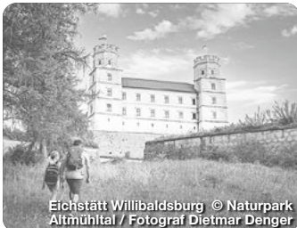
Eichstätt Willibaldsburg

TreffpunktDeutschland.de/eichstaett-region