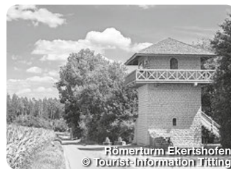
Römerturm Eckertshofen

Hier überraschen mehr als 70 Nachbildungen der Urzeitgiganten in Lebensgröße. Beim Fossilenschlagen in der Mitmachhalle gehen alle mit Hammer und Meißel auf die Suche nach echten Versteinerungen. Dinopark 1, Denkendorf