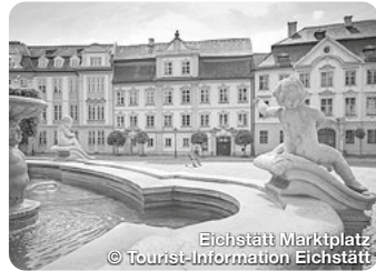
Eichstätt Marktplatz