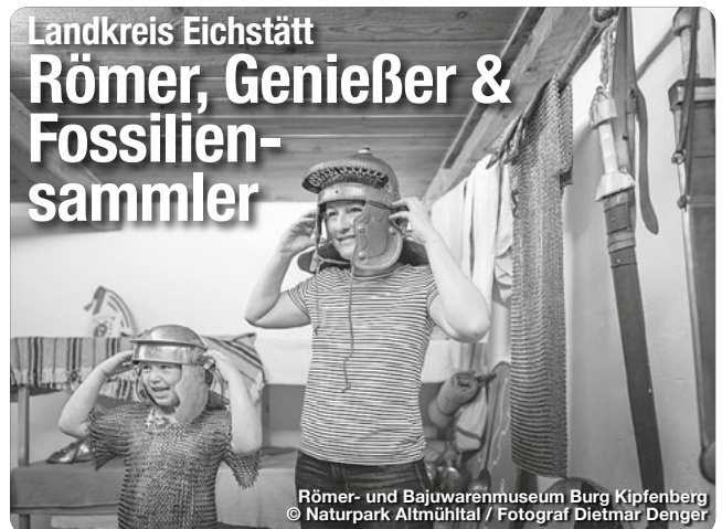
Römer- und Bajuwarenmuseum Burg Kipfenberg

Das Urdonautal rund um Wellheim, über dem weithin sichtbar die majestätische Burgruine thront, liegt als Ausläufer des Altmühltals zwischen Eichstätt und Neuburg/Donau und bietet beste Bedingungen zum Klettern, Wandern und Naturgenuss. TreffpunktDeutschland.de/wellheim