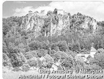
Burg Arnsberg