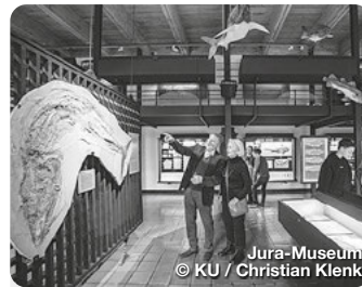
Jura-Museum © KU / Christian Klenk

Die Universitätsstadt Eichstätt liegt direkt an der Altmühl, eingerahmt von den Jurahängen der südlichen Frankenalb, gilt als Mittelpunkt des Naturpark Altmühltals und einzigartiges Barockensemble. TreffpunktDeutschland.de/eichstaett