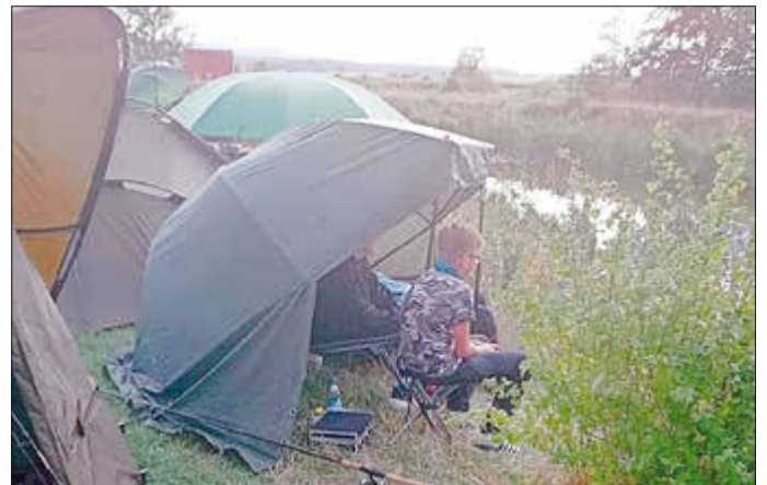
Zeltlager am Nesselbachzuleiter in Muhr am See.