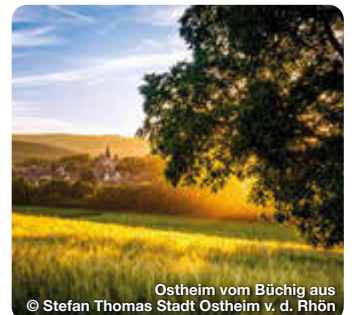
Ostheim vom Büchig aus

Durch Nordheim fließt der beschauliche Bach „Streu“ und sorgt damit für eines der Highlights des Dorfes. Denn über die Streu führt eine alte steinerne Brücke, die heute noch sehr gut erhalten ist. TreffpunktDeutschland.de/nordheim-rhoen