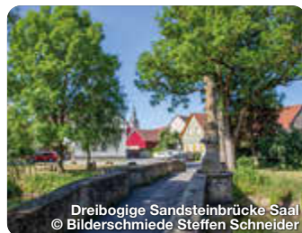
Dreibogige Sandsteinbrücke Saal