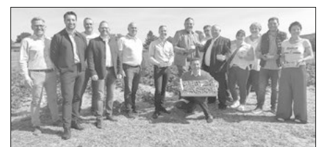
Gemeinsam eröffneten Vertreter aus Landwirtschaft, Politik, Bayerischem Bauernverband und der Genussregion Coburger Land die Erdbeersaison auf dem Erdbeerbefeld in Meeder.

Alle Infos zur Genussregion Coburger Land: www.genussregion-coburg.de