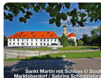
Sankt Martin mit Schloss