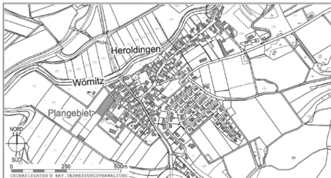
Abbildung 1: Übersichtslageplan, Maßstab 1:10.000, ALKIS, Bayerische Vermessungsverwaltung - www.geodaten.bayern.de

Die Lage des Plangebietes ist dem Lageplan zu entnehmen, der nachfolgend abgebildet ist.