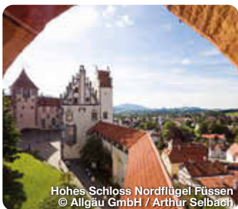
Hohes Schloss Nordflügel Füssen