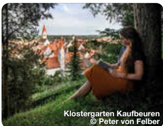
Klostergarten Kaufbeuren

Wie ein Schatzkästchen liegt er im Herzen des Allgäus, im bayerischen Süden Deutschlands. Er ist einer von neun Erlebnisräumen der Region und erstreckt sich über den gesamten Landkreis Ostallgäu, von Füssen über Pfronten, Nesselwang, Halblech, Marktoberdorf bis nach Kaufbeuren und Buchloe. Die königliche Gipfelkulisse aus Ammergauer, Allgäuer und Tannheimer Bergen wachen wie steinerne Riesen über mystische Seen, rauschende Flüsse, sanft gewellte Hügelmeere und sattgrüne Wiesen, zwischen die Dörfer und historischen Städte eingebettet sind. Die archaische Poesie der Landschaft wirkt wie ein großer, weiter Park, der sich vor den vielen Schlössern und Burgen der Region ausbreitet, vor allem zu Füßen des Märchenschlosses Neuschwanstein. TreffpunktDeutschland.de/ostallgaeu