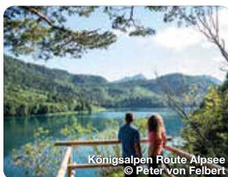
Königsalpen Route Alpsee