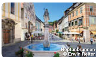
Neptunbrunnen © Erwin Reiter