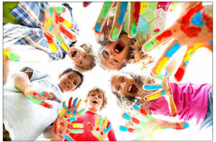
Bildunterschrift: Die Stadt Günzburg hat mit zahlreichen Vereinen und Institutionen ein spannendes Ferienprogramm für die Sommerferien vorbereitet