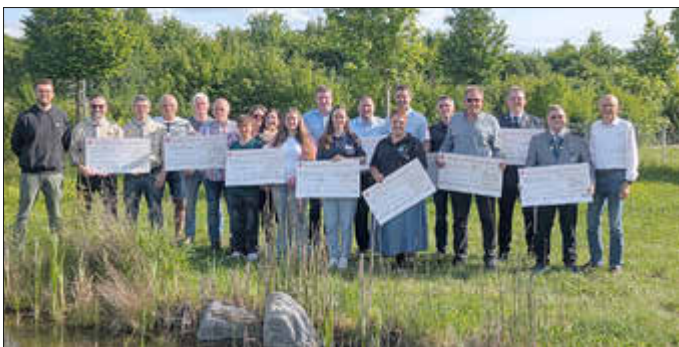
Der Landkreis Günzburg und der Kreisabfallwirtschaftsbetrieb würdigten das Engagement bei der Umweltwoche 2026.