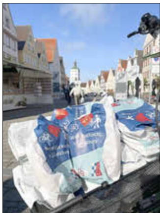
Brezeltüten mit einer Botschaft verteilt die Stadt Günzburg unter anderem auf dem Marktplatz.