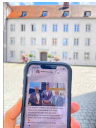
Bildunterschrift: Mit dem neuen WhatsApp-Kanal der Stadt Günzburg sind die Bürger immer aktuell informiert.