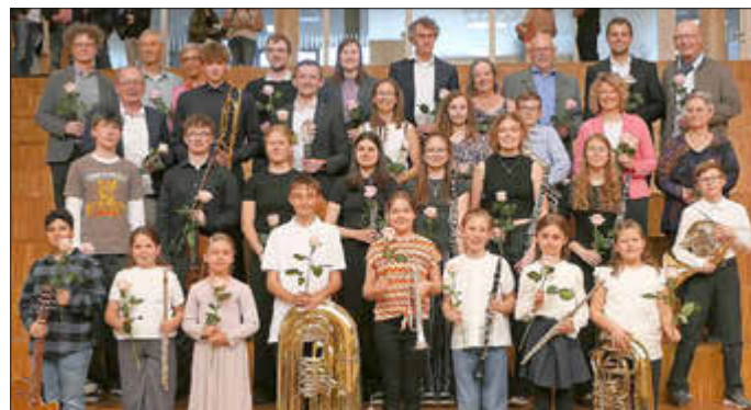
Nachwuchskünstler aus dem Landkreis Günzburg überzeugten bei ihrem Auftritt beim „Musikalischen Frühling“ im Dossenberger-Gymnasium.