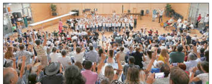
Mehr als 200 Personen wirkten beim Muttertagskonzert der Städtischen Musikschule Günzburg mit.