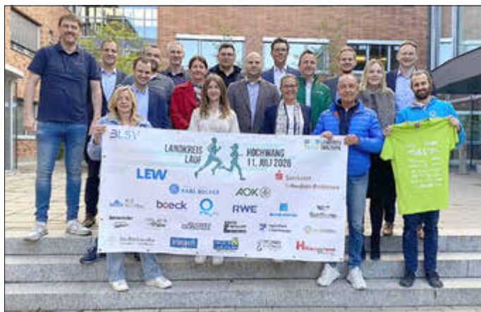
Der Landkreisläufer ist nur mit starken Partnern möglich. Die Anmeldung für die diesjährige Veranstaltung beginnt am 1. Juni.

Die Anmeldung erfolgt ab 1. Juni online über das Portal des Landkreises Günzburg unter www.landkreis-guenzburg.de/landkreisläufer . Meldeschluss für alle Disziplinen ist Mittwoch, 1. Juli 2026, um 24 Uhr.