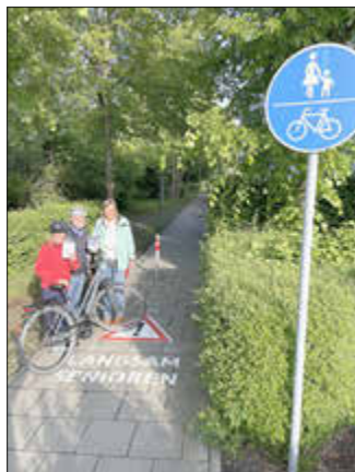
Gegenseitiges Verständnis aller Verkehrsteilnehmer standen im Mittelpunkt einer Aktion der Stadt Günzburg.