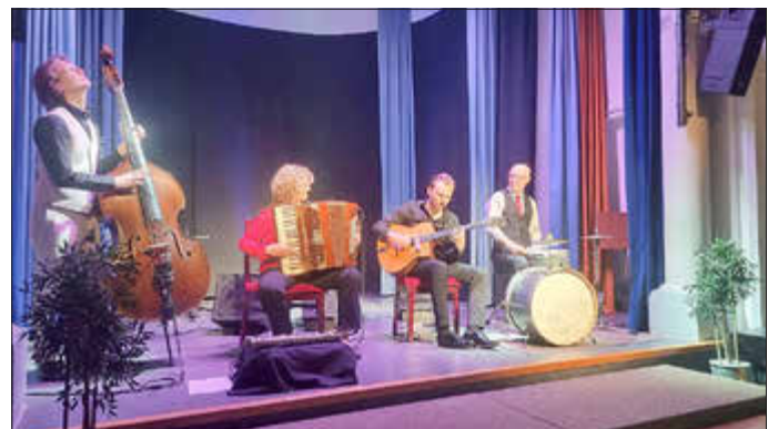
Das „Orchestra Mondo“ beim musikalischen Frühling.

Weitere Konzerte stehen noch bis Juli auf dem Programm. Eine Übersicht gibt es auf der Internetseite des Landkreises Günzburg unter www.landkreis-guenzburg.de/musikalischer-fruehling .