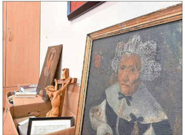
Von historischen Porträts bis zu religiöser Kunst: Am Internationalen Museumstag werfen im Heimatmuseum Günzburg zwei Experten einen Blick auf die Objekte.