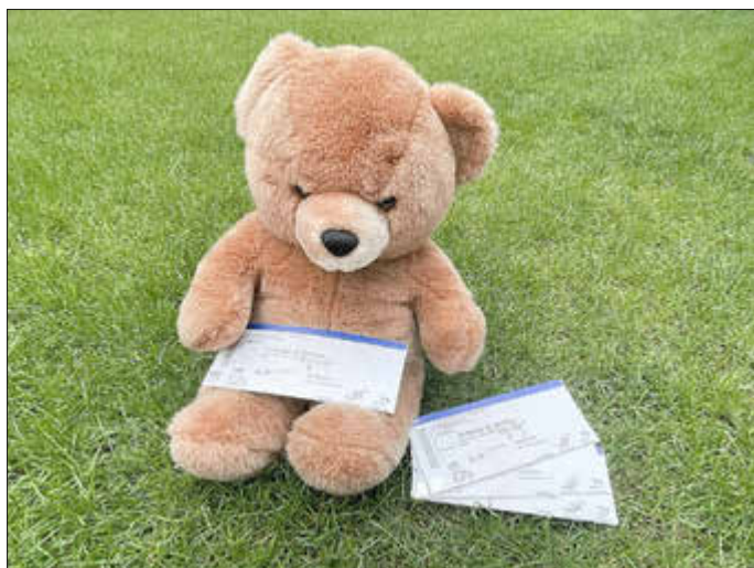
Für die Veranstaltung „Die Abenteuer der Bärenbrüder“ werden Freikarten verlost.